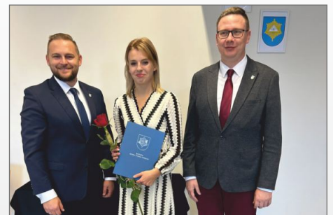
Dzień Edukacji Narodowej z wyróżnieniami