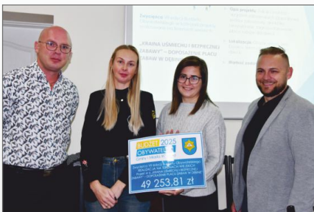
Wyniki głosowania – Budżet Obywatelski 2025 r.