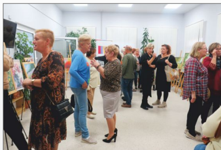
Wystawa na Fyrtlu