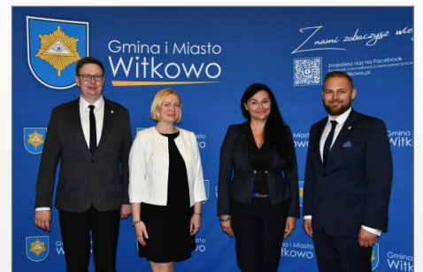
Z prac Rady Miejskiej w Witkowie