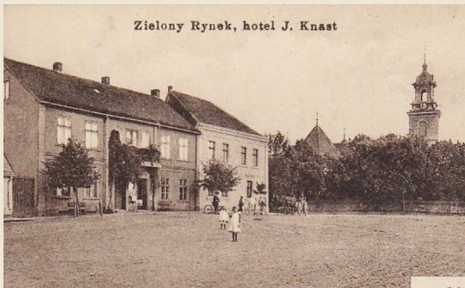
Zielony Rynek, hotel J. Knast