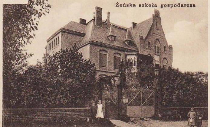
Żeńska szkoła gospodarcza

Ważniejsi proboszczowie parafii w Witkowie: