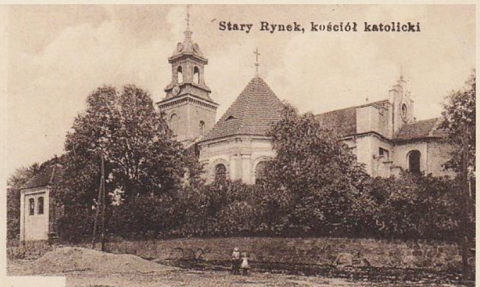
Stary Rynek, kościół katolicki