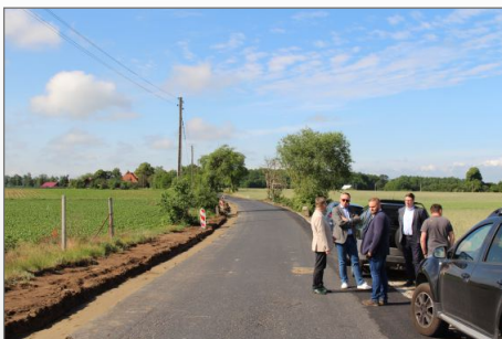
Gminne inwestycje drogowe