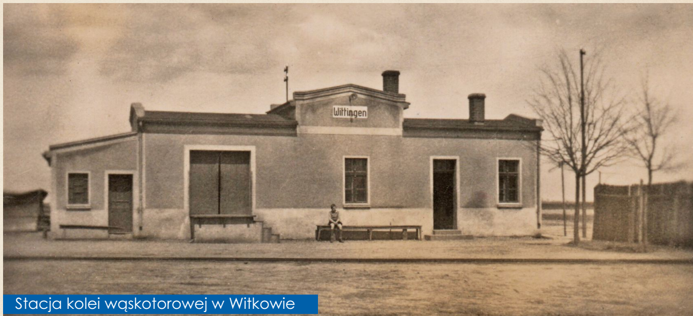
Stacja kolei wąskotorowej w Witkowie

zrejonami w Czarniejewie, Mielżynie, Niechanowie i Skórzewie. Na czele każdego rejonu stał posterunkowy, a na czele dystryktu komisarz obwodowy.