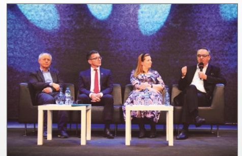
Inauguracja konkursu urbanistycznego