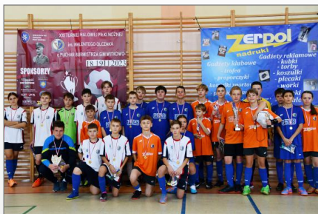
Kultowy turniej doczekał się rekordu