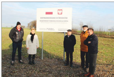
„Remont drogi gminnej w miejscowości Gorzykowo”