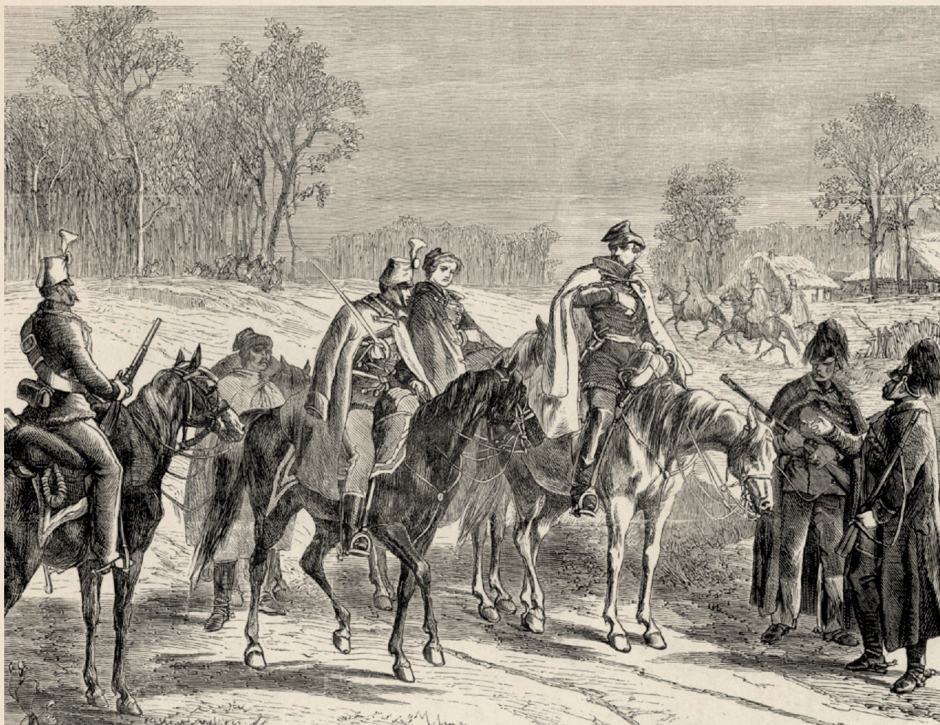
Pojmanie gen. Langiewicza przez Austriaków. Rycina z XIX wieku