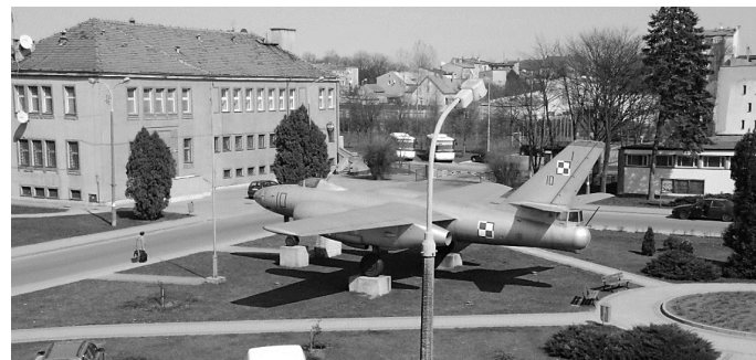
Zdjęcie 22. Witkowo – Samolot Ił-28 (tz. „Barolot”) stojący na skwerze przy Kasynie (gdzie odbywały się imprezy taneczne, kiedyś było też przedszkole, stołówka) i Klubie Garnizonowym (w środku sala kinowa widowiskowa, kawiarnia, biblioteka, modelarnia, LOK, sala myśliwska, sale konferencyjne itd.).