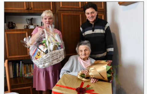
Urodziny najstarszej mieszkanki Gminy i Miasta Witkowo