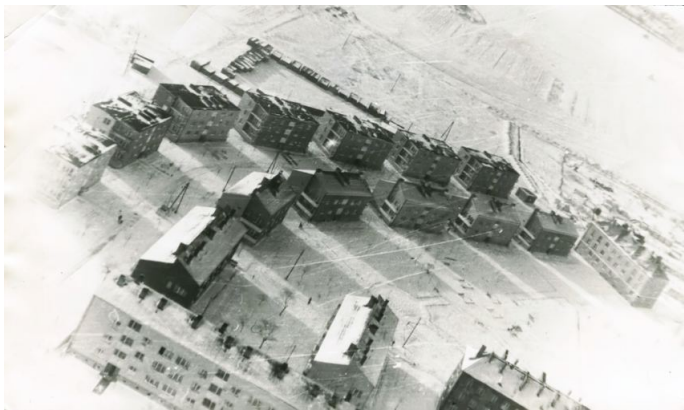
Zdjęcie 16. Witkowo – Zima 1970 r. ul. Płk. Hynka przy tzw. „Małpim Gaju”