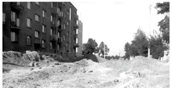
Zdjęcie 13. Blok przy ul. Płk Hynka 2 oraz widoczny fragment tzw. „Łamańca” z prawej natomiast żuraw przy budowie Szkoły Podstawowej nr 3