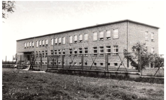
Zdjęcie 19. Witkowo 1965 r. Szkoła Podstawowa nr 2, im. Mieczysława Kalinowskiego