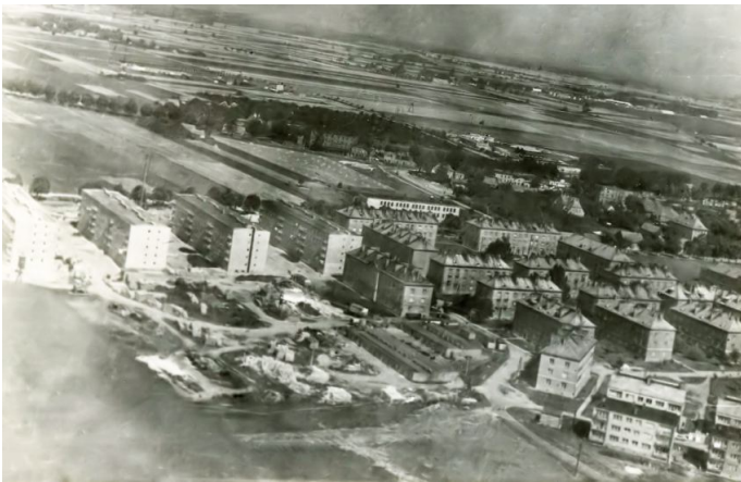
Zdjęcie 8. Centrum osiedla w Witkowie 1970r. Na wprost cztery bloki tzw. „Sochaczewskie” od lewej przy ul. Wojska Polskiego 3-1 (kiedyś; pierwszy od lewej Czarniejewska 15,...)

Żywiliśmy się różnie, przeważnie śniadania jedliśmy w stołówce cywilnej bazy w Witkowie, obiad w stołówce w Powidzu, a kolacje w restauracji „Pod Batem” w Witkowie.