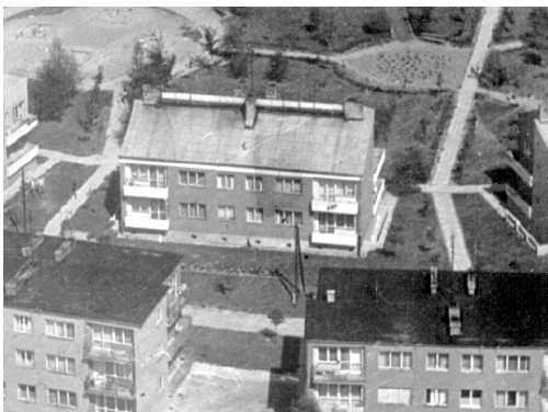
Zdjęcie 10 ul. Płk. Hynka z tyłu tzw. „Matpi gaj”

W 1956 roku – z grupy montażowej przybyłych pierwszych oficerów i podoficerów JW 5757 montujących urządzenia w obiektach lotniska Powidz – wszyscy rozjechali się po Polsce. Ja zostałem na stałe w Witkowie, do końca służby wojskowej i przeszedłem tu na emeryturę. Mój przyjaciel Henryk Karwasz wędrował po garnizonach w Polsce, a na stałe zamieszkał w Łodzi.