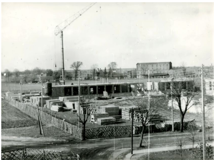
Zdjęcie 17. Witkowo – Wiosna 1971 r. w budowie Szkoła Podstawowa nr 3