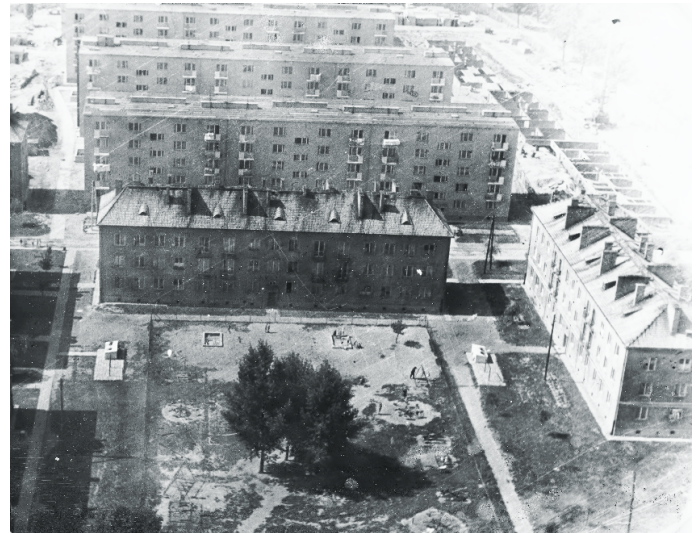
Zdjęcie 7. Na wprost blok przy ul. Płk Hynka 1 (niższy II piętrowy), dalej bloki tzw. „Sochaczewskie” (IV piętrowe) pierwszy przy ul. Płk Hynka 2 kolejne trzy przy ul. Czarniejewskiej (obecnie ul. Wojska Polskiego 1-3), z prawej tzw. „Łamaniec” przy ul. Czarniejewskiej 11 w budowie – 1970 r. oraz po prawej blok (II piętrowy) przy ul. Czarniejewskiej 9