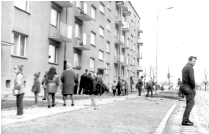
Zdjęcie 15. Czyn społeczny przy ul. Płk Hynka 2