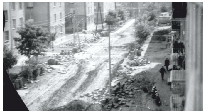
Zdjęcie 12. ul. Płk Hynka (widok z balkonu)