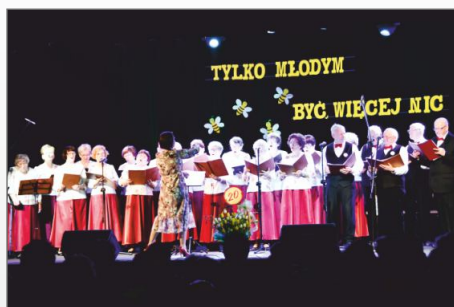
Dwudzieste urodziny zasłużonego Zespołu