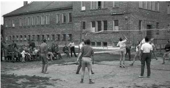
Zdjęcie 9. Kasyno w Witkowie 1967 rok

Żywiliśmy się różnie, przeważnie śniadania jedliśmy w stołówce cywilnej bazy w Witkowie, obiad w stołówce w Powidzu, a kolacje w restauracji „Pod Batem” w Witkowie.