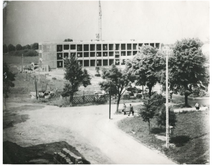
Zdjęcie 18. Witkowo – Lato 1971 r. w budowie Szkoła Podstawowa nr 3

załogi posiłki. Nie było przypadków oddaleń, spóźnień itp. Kadra nie miała żadnych kłopotów z pracą i dyscypliną. To była wspiana ekipa żołnierzy.