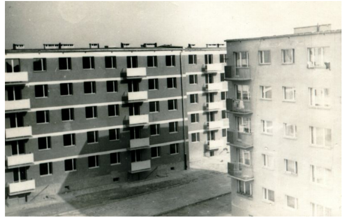
Zdjęcie 6. Końcowy etap budowy tzw. „Łamańca” przy ul. Czarniejewskiej 11 w 1971 roku

W tym czasie w lipcu 1956 roku na osiedlu wojskowym nie było żadnej organizacji przydziału mieszkań (tzw. GAM, czy też WAM), mieszkania przydziałał dowódca jednostki. Natomiast w tym czasie było nieczynne kasyno i hotel. Za nim wokół placu zabaw, stały dwa bloki przy ul. Czarniejewskiej 7 i 9 (1954r.), blok przy ul. Płk. Hynka 1 (1956r.) trzy bloki przy ul. Mickiewicza 2,4 (1954r.), ul. Mickiewicza 6 (1956r.). Inne bloki były w trakcie budowy (tzw. „Łamaniec” (1971r.), bloki „Sochaczewskie” (1969-1970r.). itd.). Dodatkowo zbudowano stadion piłkarski, jako dar wojska dla społeczności Witkowa.