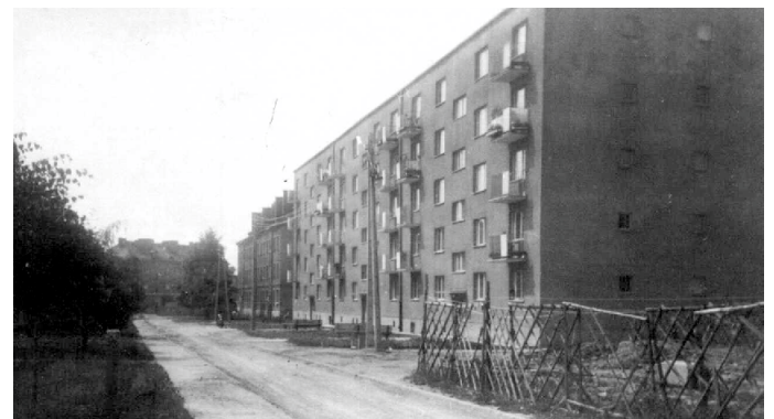
Zdjęcie 14. z prawej płot-budowa tzw. „Łamańca”, następnie blok - ul. Płk Hynka 2, w oddali blok Płk. Hynka 4 i Słowackiego 2A, fot. Z. Janke.