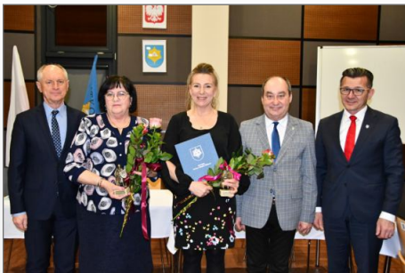
Narada z Sołtysami i Przewodniczącymi Zarządów Osiedli