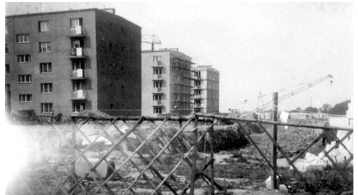
Zdjęcie 11. ul. Wojska Polskiego 1-3 (kiedyś ul. Czarniejewska) z prawej w budowie tzw. „Łamaniec” przy ul. Czarniejewskiej 11