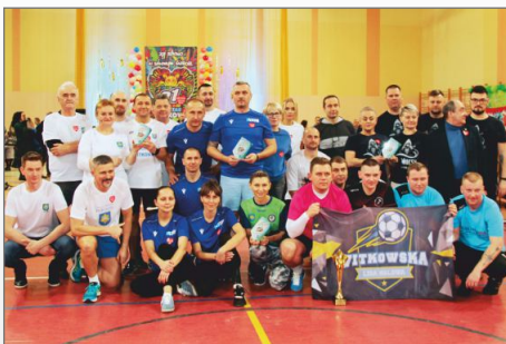
Serca Witkowsian zabity mocnej, Witkowski WOŚP przez duże „W”