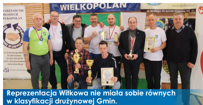
Reprezentacja Witkowska nie miała sobie równych w klasyfikacji drużynowej Gmin.