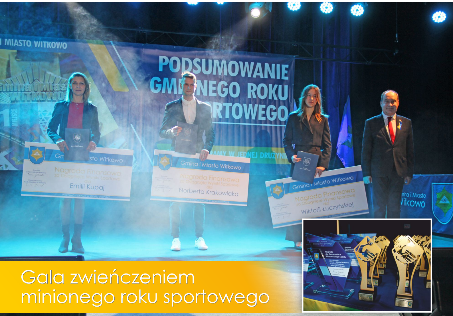
Gala zwieńczeniem minionego roku sportowego

Bezpłatny Biuletyn Informacyjny Gminy i Miasta Witkowo | Nr 2/2023