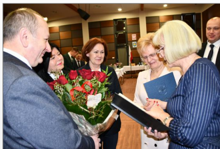
Zmiana na stanowisku Skarbnika Gminy i Miasta Witkowo