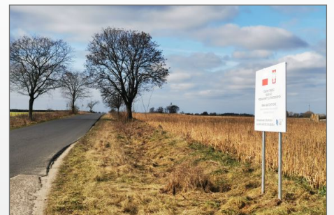
„Budowa chodników w miejscowościach: Ruchocinek i Skorzęcin”