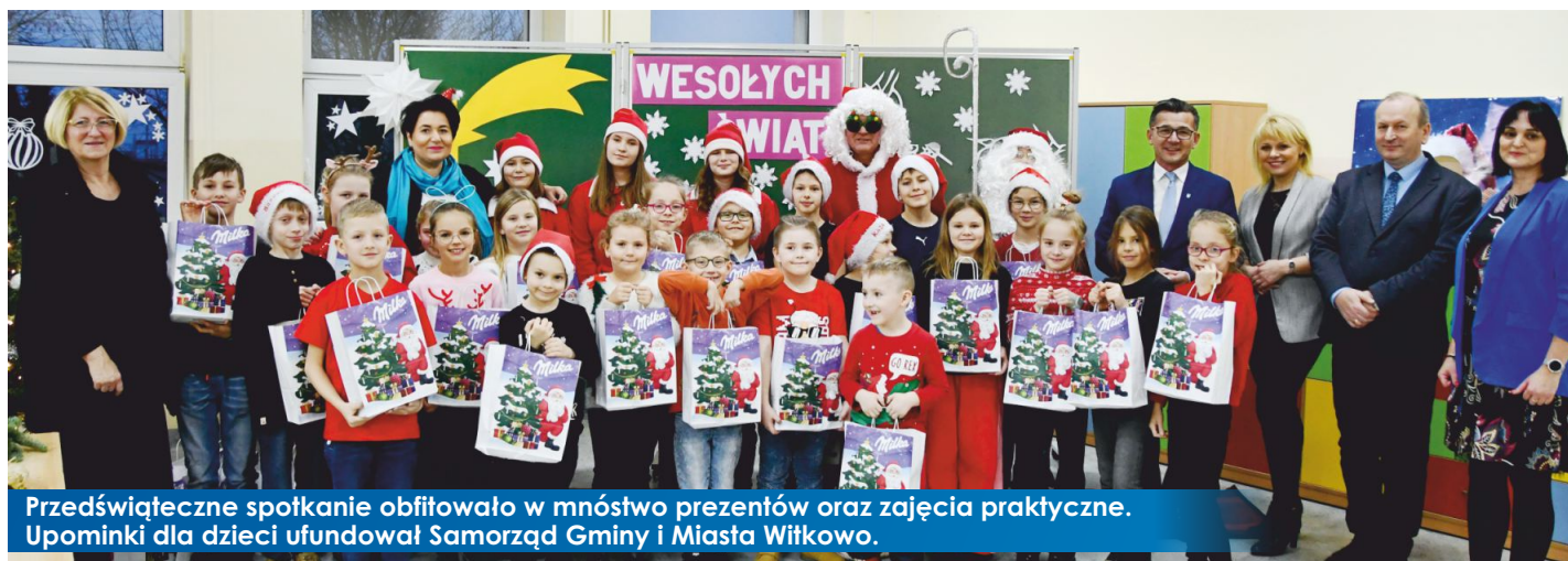
Przedświąteczne spotkanie obfitowało w mnóstwo prezentów oraz zajęcia praktyczne. Upominki dla dzieci ufundował Samorząd Gminy i Miasta Witkowo.

Dzieci ze świetlicy środowiskowej Szkoły Podstawowej nr 1 im. Adama Borysa w Witkowie aktywnie zakończyły 2022 rok. 21 grudnia uczestniczyły w warsztatach terapeutyczno-florystycznych, podczas których przygotowywały bożonarodzeniowe stroiki. Gościem specjalnym wydarzenia był Święty Mikołaj wraz ze swoimi Pomocnikami, którzy nie omieszkali wręczyć uczestnikom upominki ufundowane przez Samorząd Gminy i Miasta Witkowo.