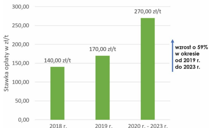
Wzrost opłaty marszałkowskiej

Łączne wynagrodzenie szacunkowe dla firmy ALKOM w 2023 roku wyniesie 4 972 689,36 zł brutto i będzie wyższe o ok. 800.000,00 zł brutto w porównaniu do 2022 roku. Umowa została zawarta na okres od 01.01.2023 r. do 31.12.2023 r.