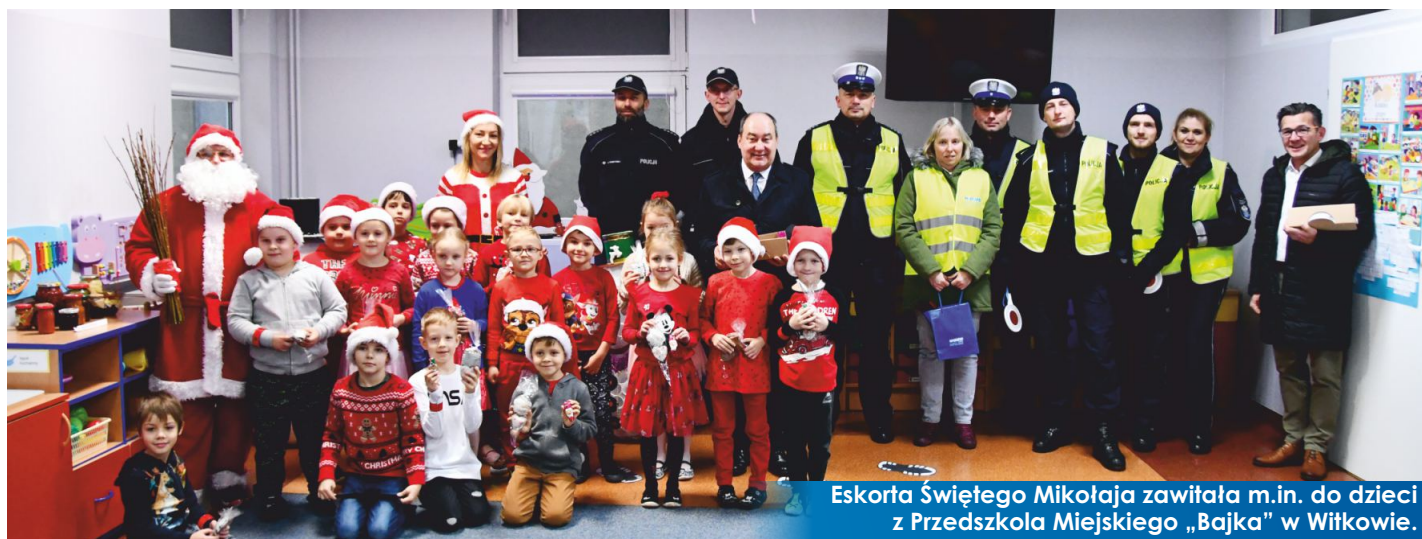
Eskorta Świętego Mikołaja zawitała m.in. do dzieci z Przedszkola Miejskiego „Bajka” w Witkowie.