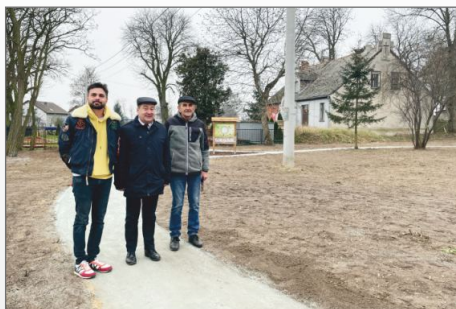
Aktywniej w Chtądowie. Powstał nowy park