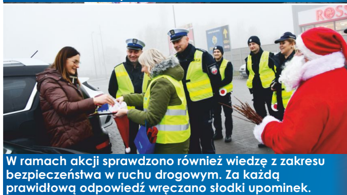
W ramach akcji sprawdzono również wiedzę z zakresu bezpieczeństwa w ruchu drogowym. Za każdą prawidłową odpowiedź wręczano słodki upominek.

Każda poprawna odpowiedź udzielona przez kierowców była nagradzana słodkim upominkiem oraz odblaskowym gadżetem. Wszystko to w ramach akcji edukacyjno-profilaktycznej pod hasłem „Mikołaje prezenty wręczają tym, co przepisy