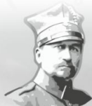
gen. J. Dowbor-Maśnicki