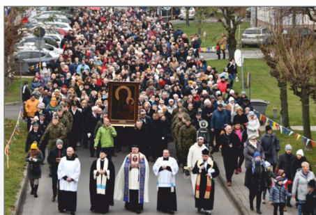
Nawiedzenie obrazu Matki Bożej Częstochowskiej w Witkowie