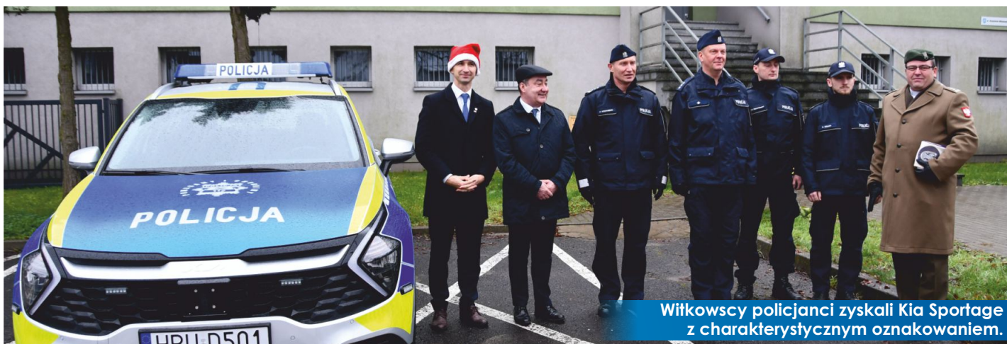
Witkowscy policjanci zyskali Kia Sportage z charakterystycznym oznakowaniem.

Od 6 grudnia br. Komisariat Policji w Witkowie wzbogacił się o nowy sprzęt. Jest nim nowoczesny radiowóz typu SUV marki Kia Sportage pozyskany przy wsparciu finansowemu Samorządów: Gminy i Miasta Witkowo, Gminy Niechanowo oraz Ministerstwa Spraw Wewnętrznych i Administracji.