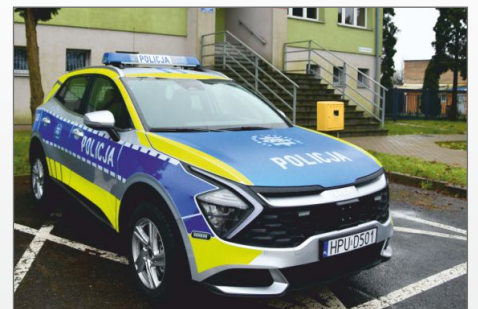
Nowoczesny radiowóz dla witkowskiej Policji