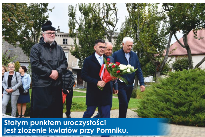
Stałym punktem uroczystości jest złożenie kwiatów przy Pomniku.

17 września w 83. rocznicę napaści sowieckiej na Polskę, uczczono pamięć ofiar tamtych wydarzeń. Uroczystość złożenia kwiatów i zniczy odbyła się przy pomniku Powstańców Wielkopolskich w Witkowie.