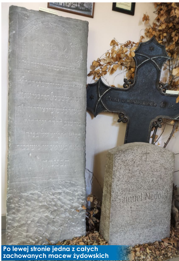
Po lewej stronie jedna z całych zachowanych macew żydowskich