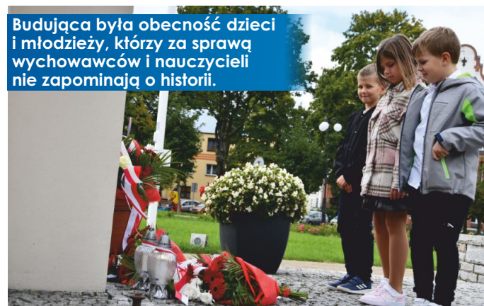
Budująca była obecność dzieci i młodzieży, którzy za sprawą wychowawców i nauczycieli nie zapominają o historii.

W spotkaniu patriotycznym uczestniczyły delegacje na czele z duchowieństwem, władzami samorządowymi, organizacjami pozarządowymi, gminnymi instytucjami, sołtysami, przedstawicielami placówek oświatowych z dziećmi oraz młodzieżą.