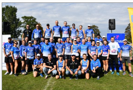
„Witkowska Dycha” na piątkę. Na starcie blisko 300 uczestników