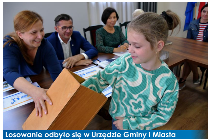
Losowanie odbyło się w Urzędzie Gminy i Miasta