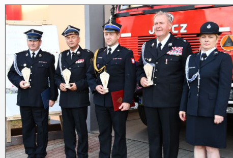
Jubileusz 80-lecia istnienia Ochotniczej Straży Pożarnej w Skorzęcinie