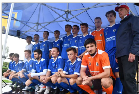
Święto najstarszego klubu sportowego w Gminie Witkowo