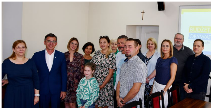
W spotkaniu oprócz wnioskodawców uczestniczyli również członkowie gminnej komisji odpowiedzialnej za piątą już edycję Budżetu Obywatelskiego.

7 września br. w siedzibie Urzędu Gminy i Miasta w Witkowie odbyło się spotkanie z autorami złożonych projektów Budżetu Obywatelskiego na 2023 rok. Miało ono na celu ustalenie kolejności projektów, które wpłynęły do naszego Urzędu i przeszły pozytywną weryfikację formalno-merytoryczną na Karcie do głosowania. Losowaniu podlegały 4 złożone wnioski.