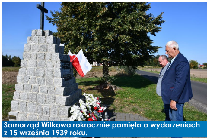
Samorząd Witkowa rokrocznie pamięta o wydarzeniach z 15 września 1939 roku.