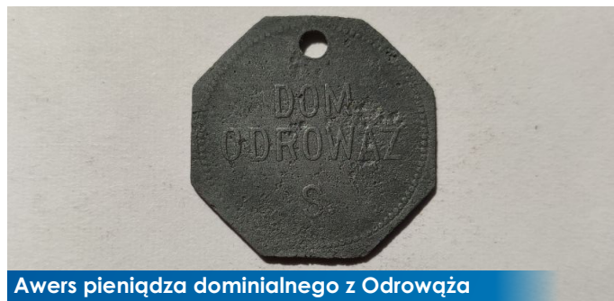
Awers pieniądza dominialnego z Odrowąża

Pieniądz dominialny na polskiej wsi przybierał różny wygląd pod względem kształtu, materiału i napisów. Dość często charakteryzowało go prymitywne wykonanie, czego nie można powiedzieć o prezentowanym egzemplarzu z Odrowąża. Niekiedy wykonywał je wiejski kowal z najprymitywniejszego i dostępnego materiału. Monety bite przez fachowe warsztaty i mennice były już wykonane z dbałością o detale. Wytwarzano je za