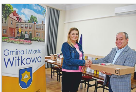
Laptopy dla rodzin z Gminy i Miasta Witkowo