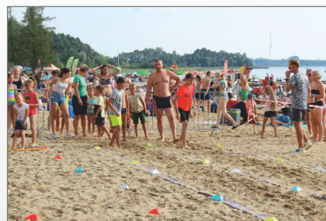
Miasteczko Lekkoatletyczne w Skorzęcinie