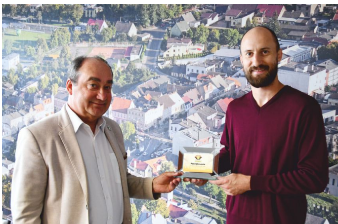
Podczas spotkania omówiono m.in. dalszą współpracę na linii Samorząd Witkowo – Klub MMA Witkowo.

Hasło „Witkowo – gramy w jednej drużynie” przyświeca kolejnym sportowym inicjatywom Samorządu Gminy i Miasta Witkowo. Jedną z nich była Gala MMA z okazji 10-lecia Klubu MMA Witkowo, która odbyła się w ramach tegorocznych Dni Witkowa.