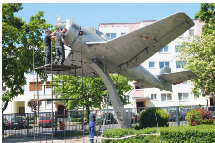
W maju rozpoczął się demontaż śmigła i wycinanie uszkodzonych fragmentów poszycia samolotu