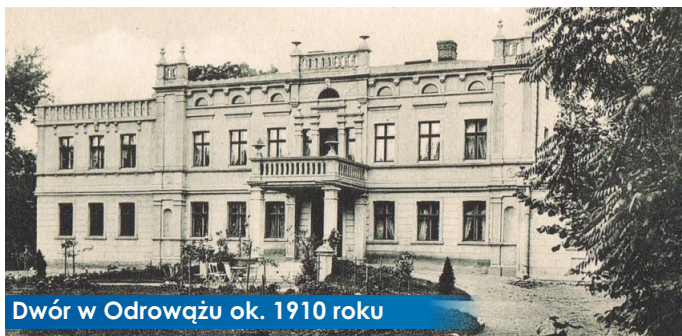
Dwór w Odrowążu ok. 1910 roku

W sporządzonej przez Okręgowy Ośrodek Rzecznostwa i Doradztwa Rolniczego w Poznaniu Ewidencji parku dworskiego w Odrowążu 1980 r. zawarta została krótka analiza historyczna byłego majątku ziemskiego rodziny Skarbek – Malczewskich. Kończy je zdanie – Dwór ten jak i pozostałe zabudowania (za wyjątkiem stodoły i owczarni) został kompletnie zdewastowany i znajduje się w ruinie.