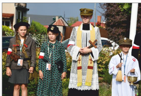
Ku Pamięci Bohaterskiego Zrywu