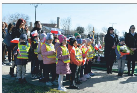
Ku pamięci Ofiar Zbrodni Katyńskiej

„Tracąc pamięć, tracimy tożsamość” 231. rocznica uchwalenia Konstytucji 3 maja