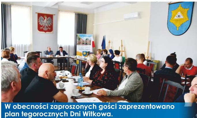
W obecności zaproszonych gości zaprezentowano plan tegorocznych Dni Witkova.

Dni Witkova 2022 były tematem spotkania organizacyjnego w związku z obchodami, które zaplanowano na 18 i 19 czerwca. Głównym punktem obrad było omówienie programu, który uświetni witkowskie święto.