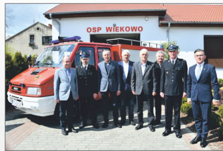
Samochód z OSP Wiekowo trafił na Ukrainę