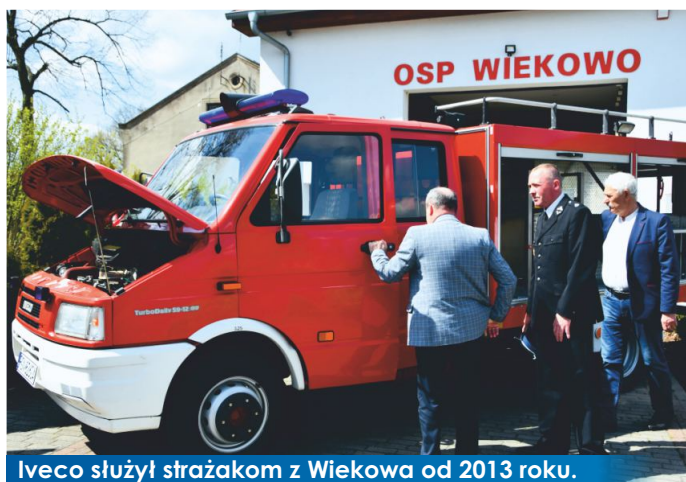
Iveco służył strażakom z Wiekowa od 2013 roku.

Nie ustaje polskie wsparcie dla ogarniętej wojny Ukrainy. Do Zarządu Głównego Państwowej Służby Ukrainy do Spraw Sytuacji Nadzwyczajnych z terenu Wielkopolski trafiły samochody ratowniczo-gaśnicze.