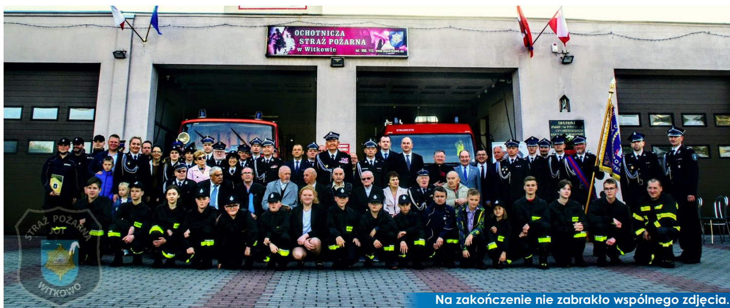
Na zakończenie nie zabrakło wspólnego zdjęcia.

„Kiedy zostajesz strażakiem – właśnie zdałeś największy egzamin z odwagi. Potem zostaje już tylko ciężka praca” – słowa Edwarda F. Crokera przyświecały 14 maja obchodom Dnia Strażaka zorganizowanym przez Ochotniczą Straż Pożarną w Witkowie.