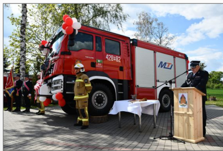
Historyczny dzień w dziejach OSP Mielżyn