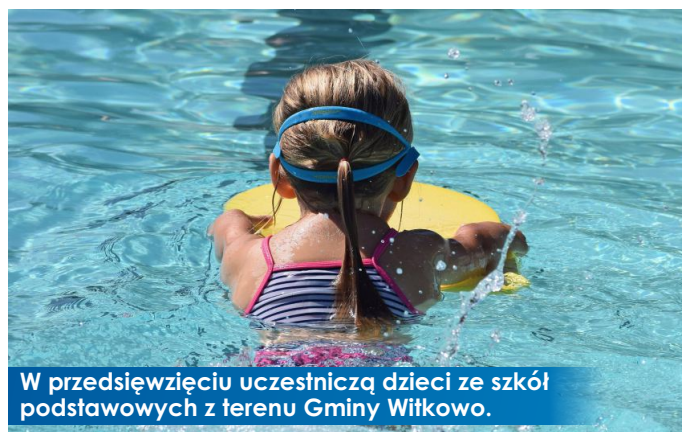
W przedsięwzięciu uczestniczą dzieci ze szkół podstawowych z terenu Gminy Witkowo.

To kolejna edycja realizowanego od 2018 roku przedsięwzięcia związanego z kursem podstaw nauki pływania oraz doskonalenia swoich umiejętności na basenie w Gnieźnie. W tym roku do Programu „Umiem pływać” zakwalifikowano tylko 45 uczniów z terenu naszej gminy, ze zgłoszonych w 2021 r. 180 dzieci. Program przewiduje dofinansowanie ze środków Ministerstwa Sportu i Turystyki w wysokości 230,00 zł na jednego ucznia oraz kwoty 215,00 zł, pochodzącej z budżetu gminy. W związku ze znacznym zmniejszeniem liczby dzieci biorącej udział w tej edycji programu, Gmina i Miasto Witkowo sfinansuje