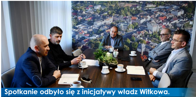
Spotkanie odbyło się z inicjatywy władz Witkowa.