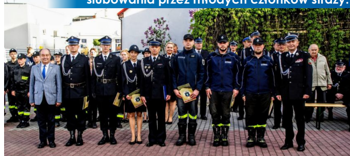
Ważnym punktem uroczystości było złożenie ślubowania przez młodych członków straży.

Samorząd Gminy i Miasta w Witkowie składa wyrazy najwyższego uznania wszystkim tym, którzy zawodowo i społecznie, bez względu na porę dnia i nocy czuwają nad bezpieczeństwem naszych mieszkańców.