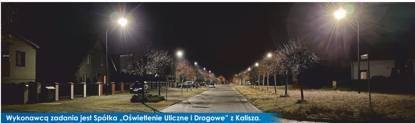
Wykonawcą zadania jest Spółka „Oświetlenie Uliczne i Drogowe” z Kalisza.

W kolejnym etapie zostaną zmodernizowane linie oświetlenia przy ulicach: Jana Pawła II, Strażkowska, Jasna, Spokojna, Rzemieślnicza.