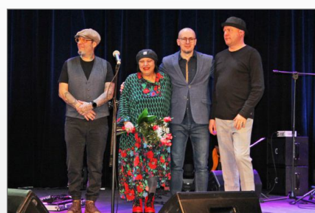
Koncert Gwiazdy polskiej estrady – Grażyny Łobaszewskiej