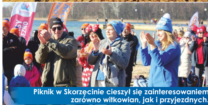
Piknik w Skorzęcinie cieszył się zainteresowaniem zarówno witkowiec, jak i przyjezdnych.