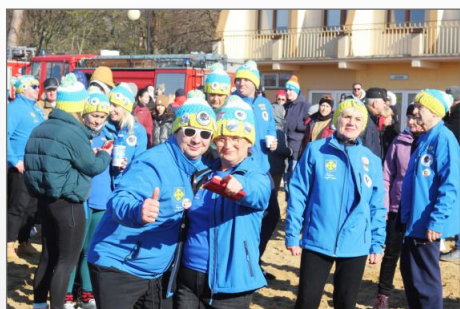
Pomagali i morsowali na plaży w Skorzęcinie

Dzięki Waszej pomocy zebraliśmy kwotę: 31 544, 83 zł.