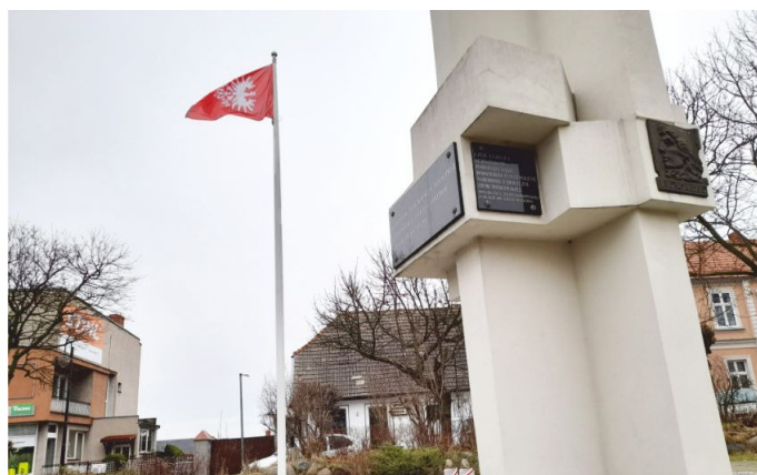
16 lutego przy Pomniku Powstańców Wielkopolskich zawieszono flagę i zapalono symboliczne znicze.

O tym także ważnym wydarzeniu nie zapomniano także w Witkowie.