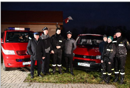
Przekazanie samochodów dla Jednostek OSP z Gminy Witkowo