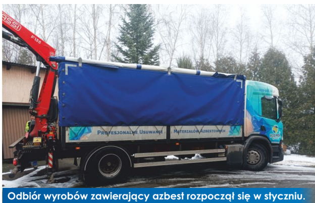
Odbiór wyrobów zawierający azbest rozpoczął się w styczniu.

W ramach realizacji przedsięwzięcia: „Likwidacja wyrobów zawierających azbest na terenie Powiatu Gnieźnieńskiego w latach 2021-2022”, w styczniu 2022 roku rozpoczęły się bezpłatne odbiory wyrobów zawierających azbest na terenie Gminy Witkowo.