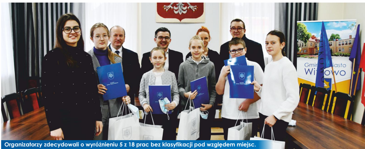
Organizatorzy zdecydowali o wyróżnieniu 5 z 18 prac bez klasyfikacji pod względem miejsc.

Młodzież zapobiega pożarom – to nazwa konkursu plastycznego propagującego zachowania ochrony przeciwpożarowej zorganizowanego przez Oddział Miejsko-Gminny Związku Ochotniczych Straży Pożarnej RP w Witkowie oraz Samorząd Gminy i Miasta Witkowo. Po ocenie, Jury postanowiło wszystkim pracom zakwalifikowanym do etapu wojewódzkiego nadać tytuł: wyróżnienie.