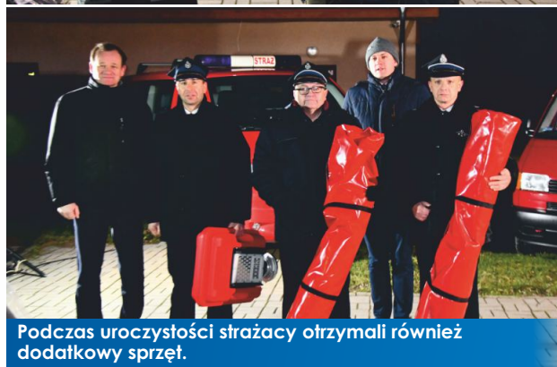
Podczas uroczystości strażacy otrzymali również dodatkowy sprzęt.