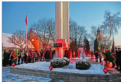
Obchody 103. rocznicy wybuchu Powstania Wielkopolskiego