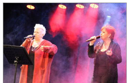
Koncert Ewy Olszewskiej