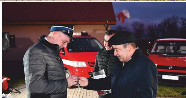
Przekazanie kluczyków od Volkswagena T4 odbyło się przy udziale władz Witkowa.

- W tym miejscu chciałbym bardzo serdecznie podziękować Komendantowi Wojewódzkiemu za przychylenie się do wniosku OSP Ruchocinek. Oddzielne podziękowania kieruję również do Komendanta Powiatowego oraz Posła Zbigniewa Dolaty, którzy zabiegali o to, aby samochód z PSP w Gnieźnie trafił właśnie do Ruchocinka. Myślę, że ta transakcja doprowadzi do zwiększenia mobilności naszych jednostek OSP. Druhowie z tych jednostek biorą udział w zawodach strażackich, ale przede wszystkim zabezpieczają liczne imprezy i inicjatywy lokalne. Mam nadzieję, że pojawienie się pierwszego