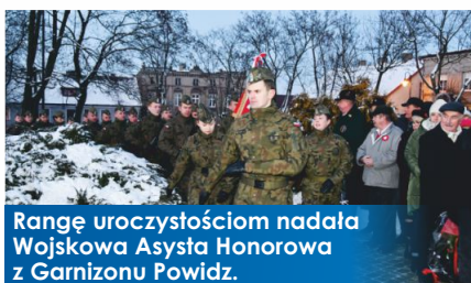
Rangę uroczystościom nadała Wojskowa Asysta Honorowa z Garnizonu Powidz.

Po złożeniu kwiatów przez przybyłe delegacje, odśpiewano „Rotę”, a otoczenie Parku Kościuski rozświetliło biało-czerwonymi barwami. Wszystko za