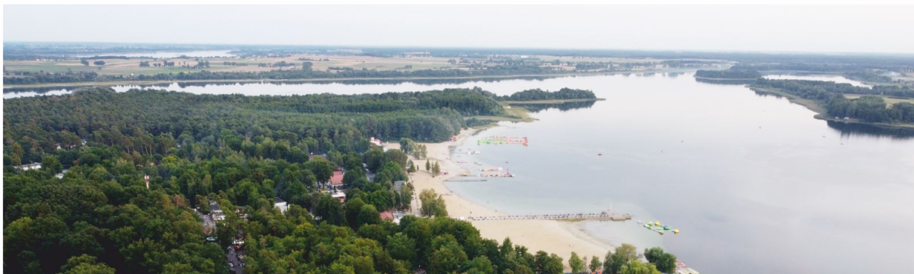
Dotychczasowa sieć energetyczna była przestarzała i nie zapewniała należytej dostawy prądu do Ośrodka w Skorzęcinie.

Dotychczasowa sieć energetyczna była przestarzała i nie zapewniała należytej dostawy prądu zgodnie z zapotrzebowaniem poszczególnych odbiorców. Dlatego też wszelkie sprawy związane z dostawą energii elektrycznej na terenie OW Skorzęcin należy załatwiać w ENERGA Operator SA w Słupcy, ul. B. Prusa 3, 62-400 Słupca lub z dostawcami posiadającymi stosowne zezwolenia na sprzedaż energii elektrycznej.