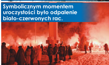
Symbolicznym momentem uroczystości było odpalenie biało-czerwonych rac.