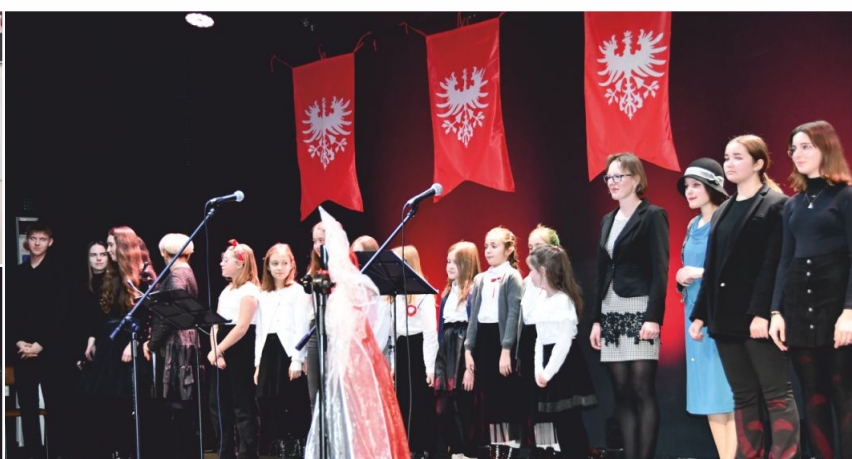
Grudniowe wydarzenie zwieńczył program patriotyczny na deskach sceny Centrum Kultury im. Krzysztofa Szkuclarka.