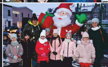
Na uczestników czekały pierniki oraz gorąca czekolada.