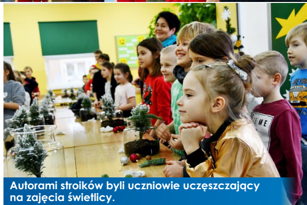
Autorami stroików byli uczniowie uczęszczający na zajęcia świetlicy.