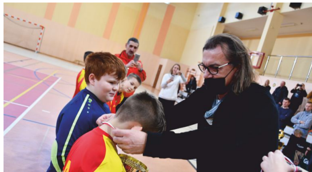
Jednym z organizatorów wydarzenia był Ośrodek Kultury, Sportu i Rekreacji w Witkowie.

W inicjatywie organizowanej przez Samorząd Gminy i Miasta Witkowo, Ośrodek Kultury, Sportu i Rekreacji, Gminny Klub Sportowy „Vitcovia” oraz firmę BiW Ubezpieczenia, uczestniczyło 7 drużyn: Chrobry Gniezno, Mieszko Gniezno, Sokół Mieścisko, Łotnik Poznań, MKS Trzemeszno oraz GKS Vitcovia Witkowo I i GKS Vitcovia Witkowo II. Najlepsi tego dnia okazali się przyjezdni z Trzemeszna, wyprzedzając Mieszko Gniezno (2) i Sokół Mieścisko (3). Dwie witkowskie reprezentacje zajęły kolejno 4 (GKS Vitcovia Witkowo II) i 5 (GKS Vitcovia Witkowo I) miejsce.