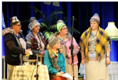
Spektakl seniorów z Czarniejewa