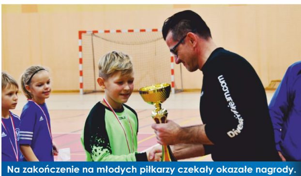
Na zakończenie na młodych piłkarzy czekały okazałe nagrody.

Po rocznej przerwie spowodowanej pandemią, do Witkowa wróciły zmagania dzieci w ramach Mikołajkowego Turnieju Piłkarskiego. Czwarta edycja wydarzenia odbyła się 4 grudnia w hali widowiskowo sportowej przy ulicy Czerniejewskiej w Witkowie i była adresowana do młodych adeptów futbolu z rocznika 2012.