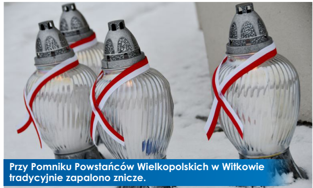
Przy Pomniku Powstańców Wielkopolskich w Witkowie tradycyjnie zapalono znicze.

Noc z 12 na 13 grudnia 1981 roku to jedna z najczarniejszych dat w historii Polski. 40 lat temu na podstawie dekretu Rady Państwa na terenie całego kraju wprowadzono stan wojenny.