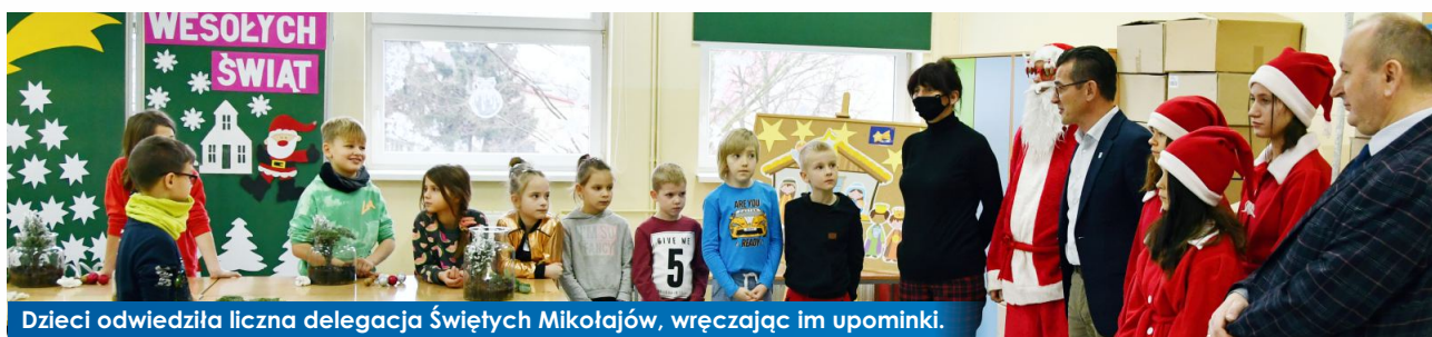
Dzieci odwiedziła liczna delegacja Świętych Mikołajów, wręczając im upominki.

16 grudnia br. w Szkole Podstawowej numer 1 im. Adama Borysa w Witkowie odbyły się warsztaty terapeutyczno-florystyczne.