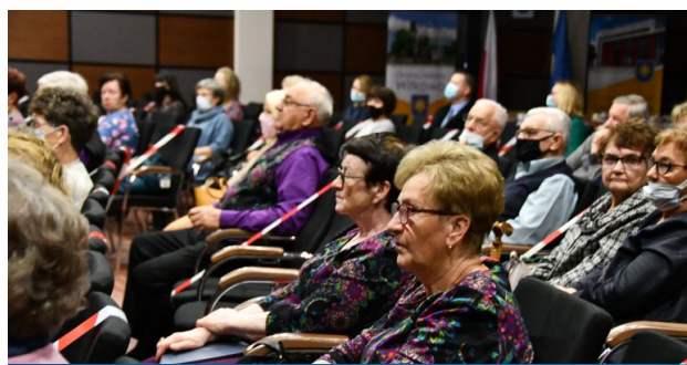
Uczestnikami projektu były m.in. osoby powyżej 60 roku życia.