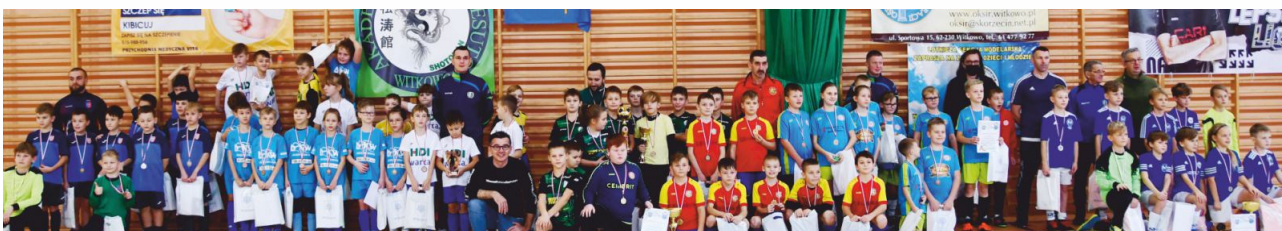
W Turnieju wzięło udział 7 drużyn z rocznika 2012. Zwieńczeniem sportowych zmagania była wspólna fotografia.

Po rocznej przerwie spowodowanej pandemią, do Witkowa wróciły zmagania dzieci w ramach Mikołajkowego Turnieju Piłkarskiego. Czwarta edycja wydarzenia odbyła się 4 grudnia w hali widowiskowo sportowej przy ulicy Czerniejewskiej w Witkowie i była adresowana do młodych adeptów futbolu z rocznika 2012.