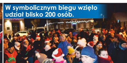
W symbolicznym biegu wzięło udział blisko 200 osób.