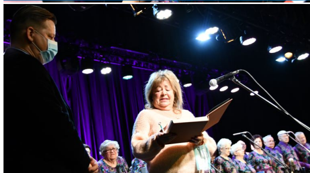
Uroczyste zakończenie przedsięwzięcia odbyło się w sali widowiskowej Centrum Kultury im. Krzysztofa Szukdlarka.