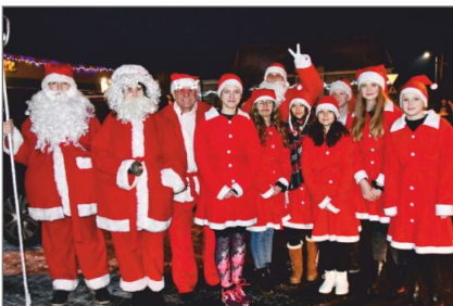
Mikołajkowy bieg w Witkowie – Każdy był zwycięzcą

Warsztaty terapeutyczno-florystyczne Uczestników odwiedził Święty Mikołaj wraz ze Śnieżynkami