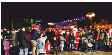
Burmistrz podkreślał, że tego dnia nie liczy się miejsce na mecie, ale przede wszystkim udział i możliwość spotkania się we wspólnym gronie.

Więcej zdjęć na www.witkowo.pl/galeria Zeskanuj zamieszczony kod QR aby przejść na stronę internetową