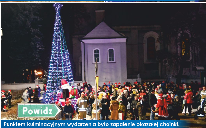
Punktem kulminacyjnym wydarzenia było zapalenie okazałej choinki.