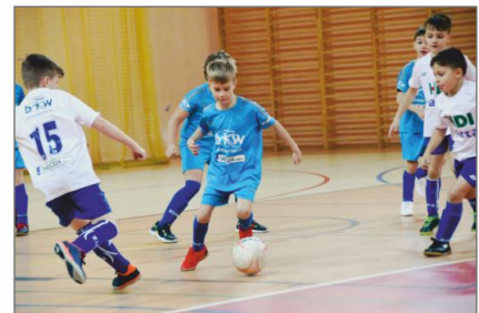
Podtrzymali turniejową tradycję