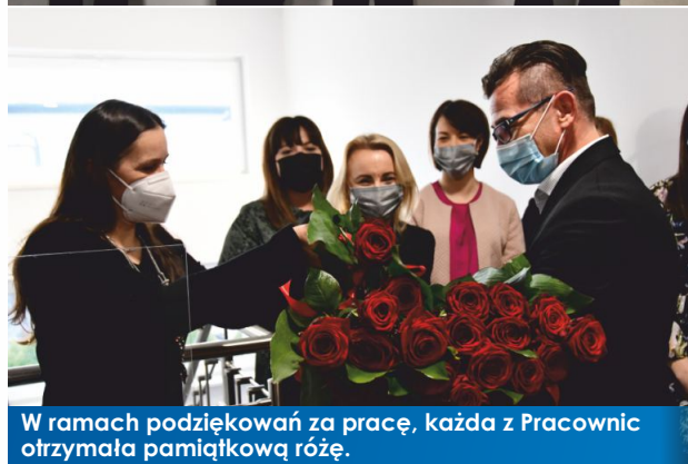
W ramach podziękowań za pracę, każda z Pracownic otrzymała pamiątkową różę.

Oprócz stosownego adresu wręczonego Kierownikowi MGOPS Witkowo, każda z pracownic otrzymała także pamiątkową różę.