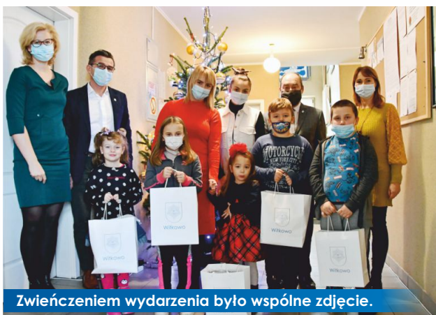
Zwieńczeniem wydarzenia było wspólne zdjęcie.

13 grudnia br. w Urzędzie Gminy i Miasta odbyło się wręczenie nagród w związku z rozstrzygnięciem konkursu „Moja Kartka Świąteczna”, zorganizowanego przez Samorząd Gminy i Miasta Witkowo. Komisja składająca się z pracowników magistratu, po obejrzeniu wszystkich 100 okazałych prac, postanowiła przyznać pięć równorzędnych pierwszych miejsc. Ich autorami byli: