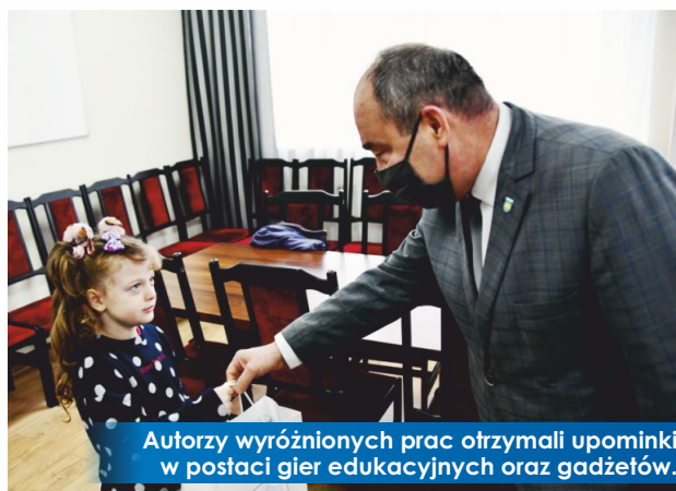
Autorzy wyróżnionych prac otrzymali upominki w postaci gier edukacyjnych oraz gadżetów.