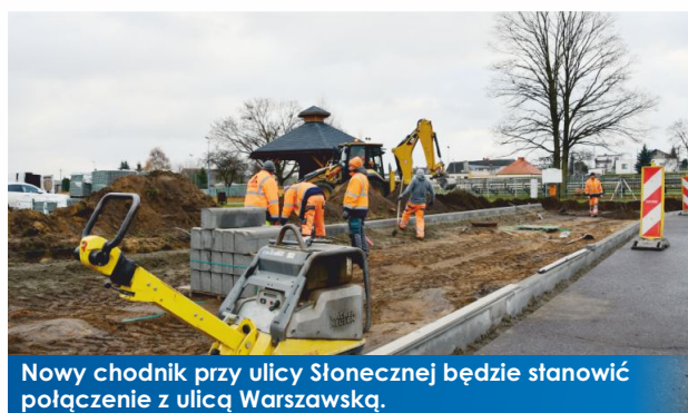
Nowy chodnik przy ulicy Słonecznej będzie stanowić połączenie z ulicą Warszawską.