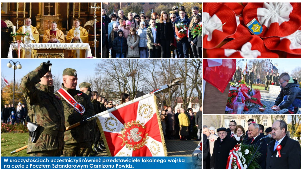
W uroczystościach uczestniczyli również przedstawiciele lokalnego wojska na czele z Pocztem Sztandarowym Garnizonu Powidz.

Druga odsłona uroczystości odbyła się przy Pomniku Powstańców Wielkopolskich i Poległych w Obronie Ojczyzny, gdzie po wysłuchaniu Hejnatu Witkowa, głos zabrał Burmistrz Gminy i Miasta Witkowo