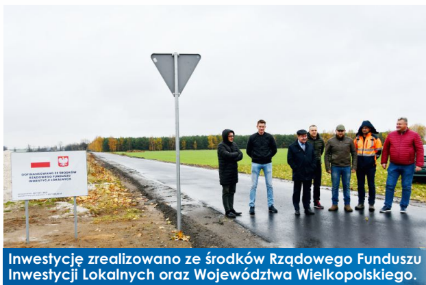
Inwestycję zrealizowano ze środków Rządowego Funduszu Inwestycji Lokalnych oraz Województwa Wielkopolskiego.

Ćwierdzin zyskał 1,05 km nowej drogi. W zakres prac wchodziło m.in. wykonanie robót ziemnych, podbudowy, ułożenie nawierzchni asfaltowej, wymiana przepustów oraz uzupełnienie oznakowania. Wykonawcą zadania był Zakład Drogowo-Transportowy – Sławomir Begier z Nekli za kwotę 1 037 000,00 zł.