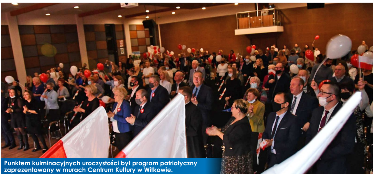
Punktem kulminacyjnych uroczystości był program patriotyczny zaprezentowany w murach Centrum Kultury w Witkowie.