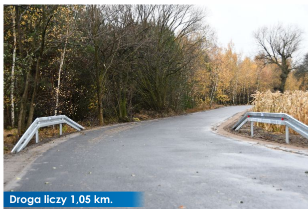
Droga liczy 1,05 km.

DOFINANSOWANIE 667 853,75 zł CAŁKOWITA WARTOŚĆ INWESTYCJI 1 037 000,00 zł