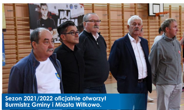
Sezon 2021/2022 oficjalnie otworzył Burmistrz Gminy i Miasta Witkowo.

Do czteromiesięcznej rywalizacji przystąpiła rekordowa liczba 16 drużyn z terenu Gminy i Miasta Witkowo oraz okolic. Walka o najwyższe trofea potrwa do 20 marca, a jej zakończeniem będzie uroczysta Gala w Centrum Kultury im. Krzysztofa Szkuclarka.