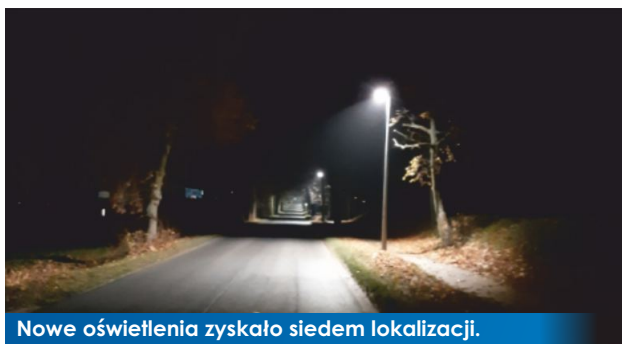
Nowe oświetlenia zyskało siedem lokalizacji.

Wzorem lat poprzednich doświetlono przejścia dla pieszych na terenie Witkowa. To kolejna inwestycja polegająca na poprawie bezpieczeństwa pieszych jako najmniej chronionych uczestników ruchu drogowego.