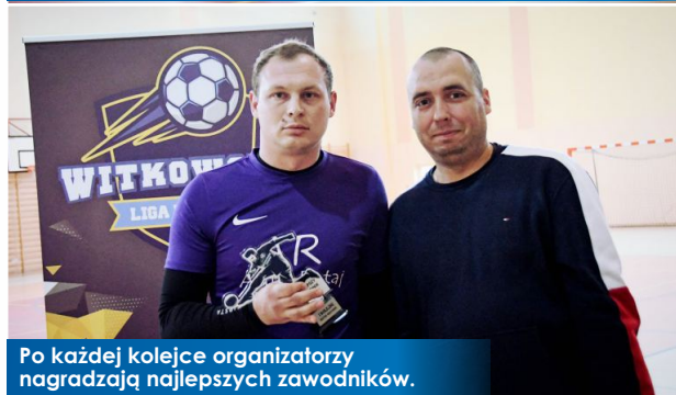
Po każdej kolejce organizatorzy nagradzają najlepszych zawodników.