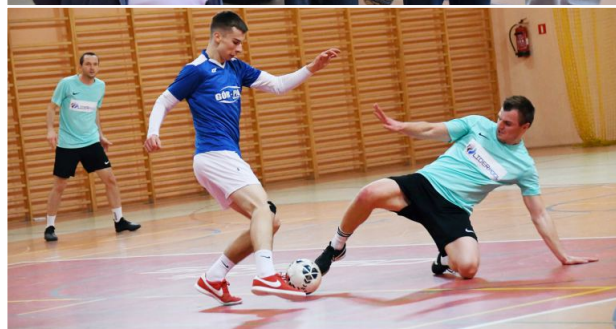
W szóstej edycji Witkowskiej Ligi Halowej uczestniczy 16 drużyn.