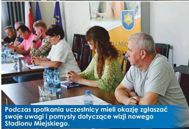
Podczas spotkania uczestnicy mieli okazję zgłaszać swoje uwagi i pomysły dotyczące wizji nowego Stadionu Miejskiego.

Opracowanie projektu zgodnego z normami Polskiego Związku Lekkiej Atletyki to jeden z podstawowych wymogów w procesie ubiegania się o środki zewnętrzne.