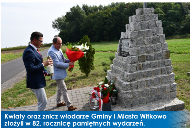
Kwiaty oraz znicz władarze Gminy i Miasta Witkowo złożyli w 82. rocznicę pamiętnych wydarzeń.