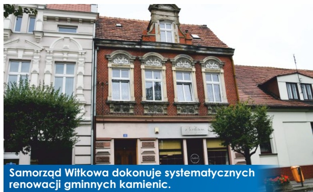
Samorząd Witkowa dokonuje systematycznych renowacji gminnych kamienic.