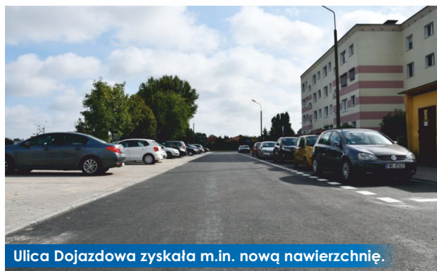
Ulica Dojazdowa zyskała m.in. nową nawierzchnię.

3 września br. odbył się odbiór inwestycji związanej z przebudową ulicy Dojazdowej w Witkowie. Zakres robót obejmował m.in. ułożenie nowej nawierzchni jezdni, budowę miejsc postojowych z kostki betonowej, poprawę odwodnienia pasa drogowego oraz uzupełnienie oznakowania pionowego i poziomego.