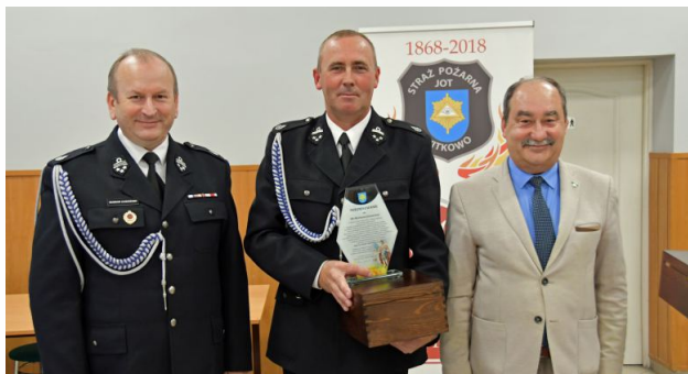
Podczas wydarzenia trzem strażakom z Gminy Witkowo, którzy uczestniczyli w gaszeniu pożarów w Szwecji oraz Grecji.

10 września br. po przymusowej przerwie spowodowanej obostrzeniami odbył się XII Zjazd Oddziału Miejsko-Gminnego Związku Ochotniczych Straży Pożarnej RP w Witkowie. Był to dzień podsumowań pracy za okres 5-letniej działalności oraz wytyczenia zadań na lata 2021-2026.