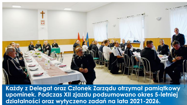
Każdy z Delegat oraz Członek Zarządu otrzymał pamiątkowy upominek. Podczas XII zjazdu podsumowano okres 5-letniej działalności oraz wytyczono zadań na lata 2021-2026.