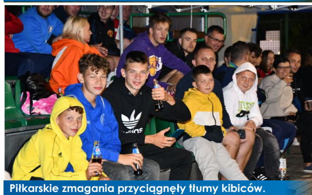
Piłkarskie zmagania przyciągnęły tłumy kibiców.