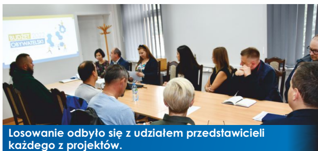
Losowanie odbyło się z udziałem przedstawicieli każdego z projektów.

23 września br. w odbyło się spotkanie z autorami złożonych projektów budżetu obywatelskiego na 2022 rok. Miało ono na celu ustalenie kolejności projektów, które wpłynęły do naszego Urzędu i przeszły pozytywną weryfikację formalno-merytoryczną na Karcie do głosowania. Losowaniu podlegały 4 złożone wnioski.