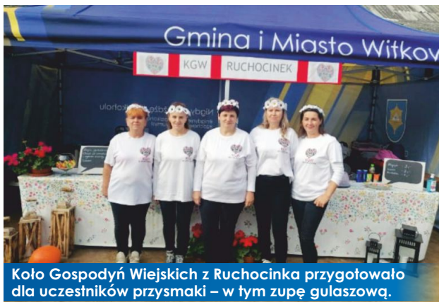
Koło Gospodyń Wiejskich z Ruchocinka przygotowało dla uczestników przysmaki – w tym zupę gulaszową.

19 września br. na terenie Prochowni – Ośrodka Jeździeckiego Zielona Enklawa w Żydowie odbyły się Pierwsze Targi Rolno-Ogrodnicze. Celem przedsięwzięcia była promocja oraz wsparcie lokalnych firm, rolników i ich produktów.