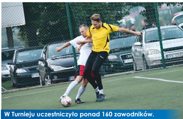
W Turnieju uczestniczyło ponad 160 zawodników.