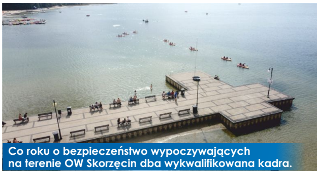
Co roku o bezpieczeństwo wypoczywających na terenie OW Skorzęcin dba wykwalifikowana kadra.

15 września br. roku w Urzędzie Gminy i Miasta Witkowo odbyło się spotkanie podsumowujące sezon w OW Skorzęcin pod kątem bezpieczeństwa na wodach Jeziora Niedźmiegiel oraz funkcjonowania punktu medycznego.