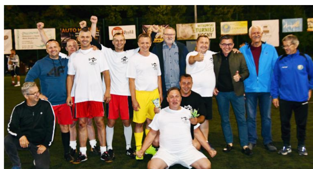
Podczas podsumowania wydarzenia wręczono 11 wyróżnień indywidualnych.