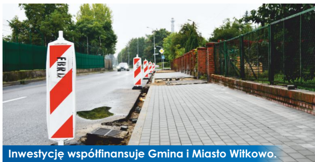
Inwestycję współfinansuje Gmina i Miasto Witkowo.