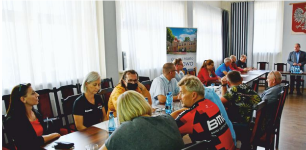
Na zaproszenie władz Samorządu Gminy i Miasta Witkowo odpowiedzieli przedstawiciele lokalnego środowiska sportowego.