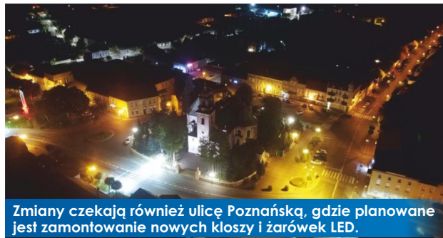
Zmiany czekają również ulicę Poznańską, gdzie planowane jest zamontowanie nowych kloszy i żarówek LED.

Trwają prace związane z modernizacją oświetlenia ulicznego w Witkowie.