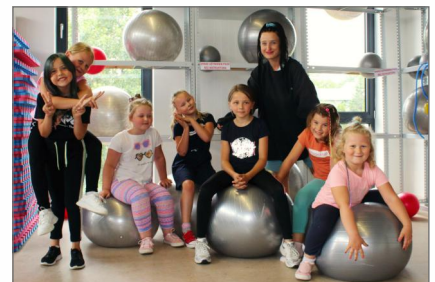
Wakacje z Ośrodkiem Kultury Sportu i Rekreacji w Witkowie