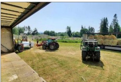
Pomoc dla mieszkańców Nowej Białej