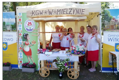
„KGW w Mielżynie” z sielawą i bocznikiem w Hotelu Moran