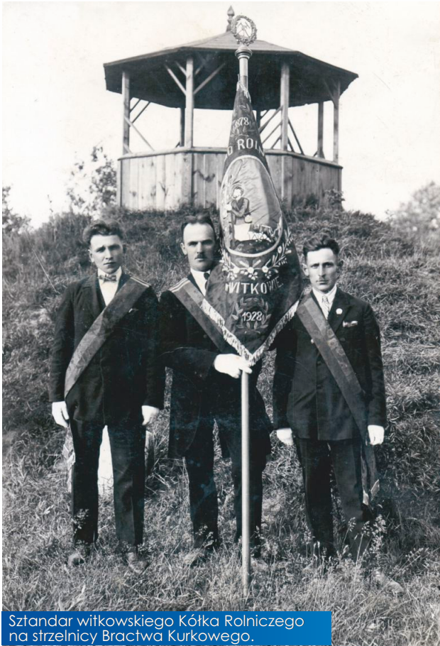
Sztandar witkowskiego Kółka Rolniczego na strzelnicy Bractwa Kurkowego.

Dwudziestego maja 1928 roku odbył się w Poznaniu zjazd kółek rolniczych z całej Wielkopolski. Brało w nim udział ponad sześć tysięcy rolników ze wszystkich zakątków regionu. Ciekawość uczestników wzbudzały nadchodzące obchody 50-lecia Witkowskiego Kółka Rolniczego jakie miały się odbyć 18 czerwca tego roku.