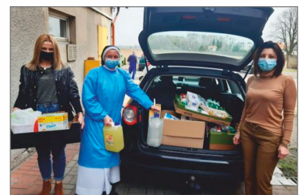
Dobry przykład w Przedszkolu Miejskim „Bajka” w Witkowie