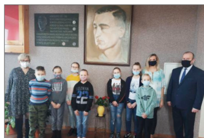
Tydzień z Patronem Szkoły w Szkole Podstawowej nr 1 w Witkowie