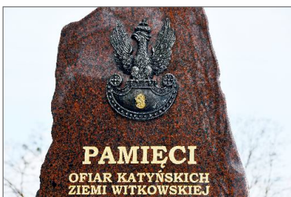
Dzień Pamięci Ofiar Zbrodni Katyńskiej