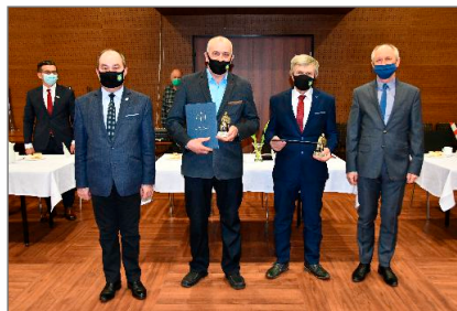
11 marca – Dzień Sołtysa