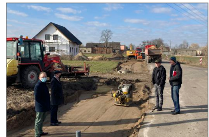
Inwestycje Powiatowe na terenie Gminy i Miasta Witkowo