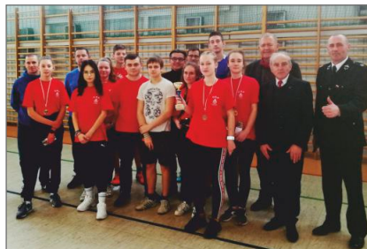
XIII Mistrzostwa Ochoćniczych Straży Pożarnych w Tenisie Stołowym