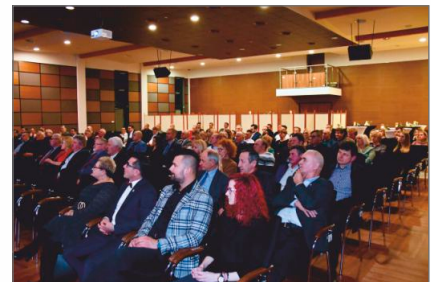
Spotkanie noworoczne z przedsiębiorcami