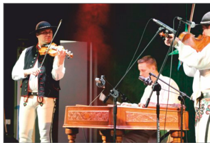
Koncert koled i pastorałek w wykonaniu Kapeli „Górska Hora”