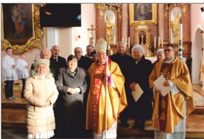
Złote i Diamentowe Gody