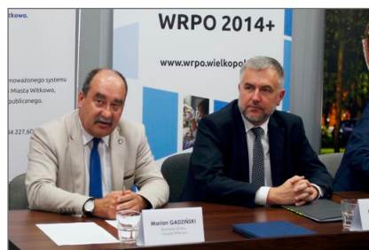
Budowa drogi dla rowerów Witkowo-Kotaczkowo

BUDŻET 2019 OBYWATELSKI Gminy i Miasta Witkowo Głosowanie