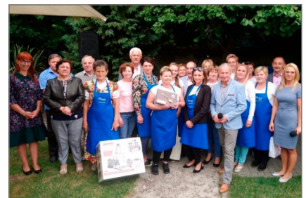
Ugotują w ogólnopolskim finale – sukces Kota Gospodyń Wiejskich z Gorzykowa