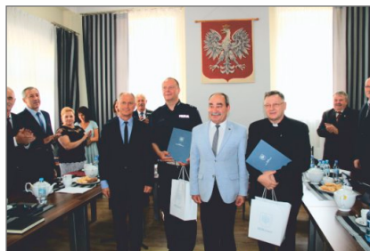
Z prac Rady Miejskiej w Witkowie