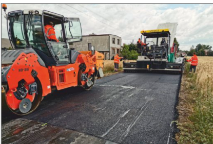
Ruszyły prace drogowe na terenie gminy

Trwają prace przy rozbudowie budynku na cele Miejsko-Gminnego Ośrodka Pomocy Społecznej w Witkowie przy ul. Gnieźnieńskiej 4