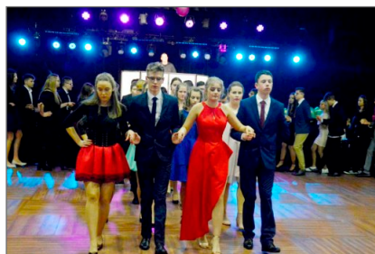
Ach! Co to był za bal...