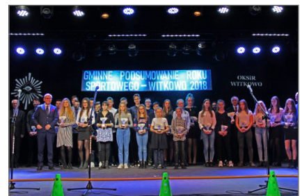
Podsumowanie Gminnego Roku Sportowego