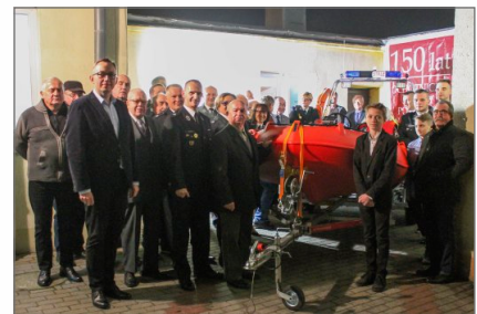
Dzień Seniora i uroczyste przekazanie nowej łodzi dla OSP Witkowo