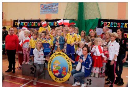
Mikołajkowy Turniej Przedszkoli