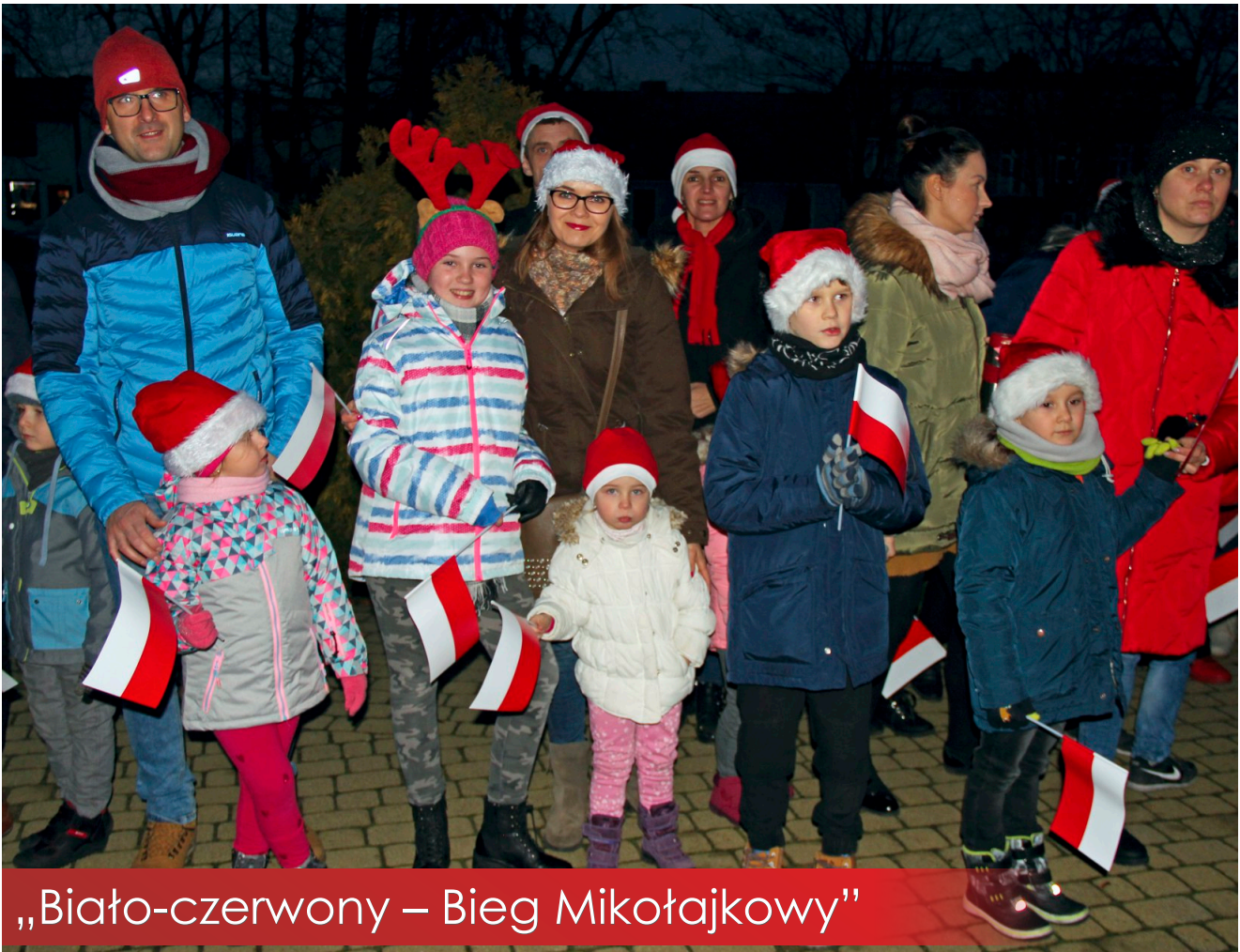
„Biało-czerwony – Bieg Mikołajkowy”

Bezpłatny Biuletyn Informacyjny Gminy i Miasta Witkowo Nr 12 - 2018