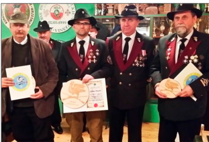
Zawody strzeleckie z okazji Narodowego Święta Niepodległości