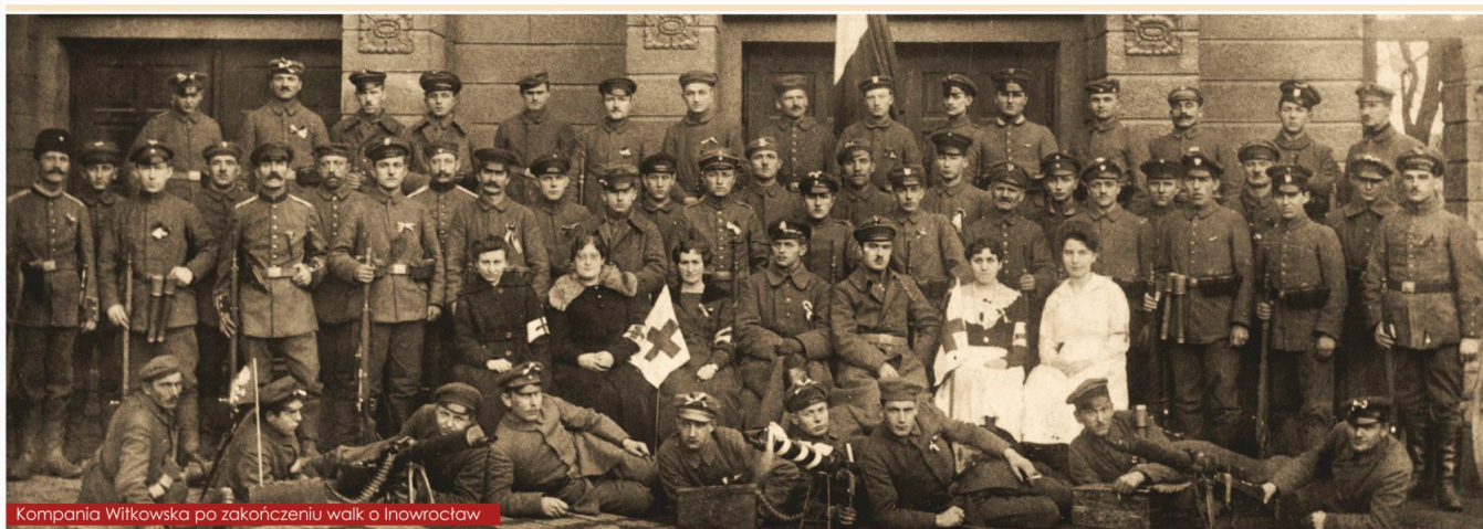
Kompania Witkowska po zakończeniu walk o Inowrocław