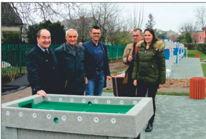
„Otwarte Strefy Aktywności w miejscowości Gorzykowo i Witkowo”