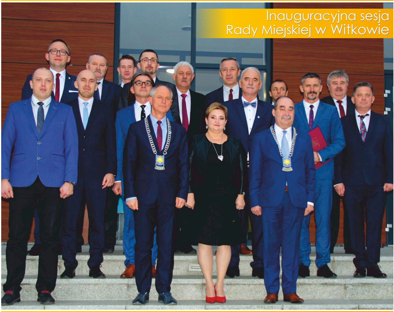
Inauguracyjna sesja Rady Miejskiej w Witkowie

Bezpłatny Biuletyn Informacyjny Gminy i Miasta Witkowo Nr 11 - 2018