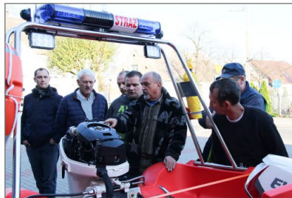
Nowa łódź dla OSP Witkowo