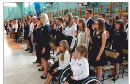
Pożegnania nadszedł czas...