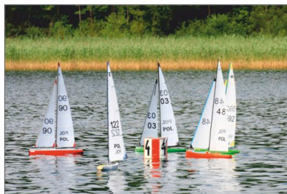
Eliminacje Mistrzostw Polski