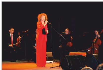
Koncert Alicji Majewskiej