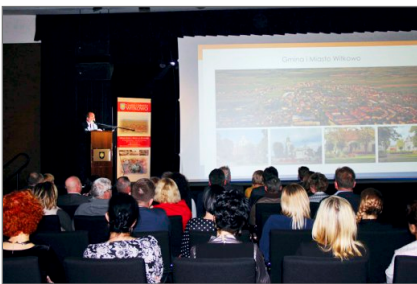
Przedsiębiorcy Gminy i Miasta Witkowo