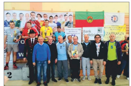
Regionalne Zawody Samorządowców w Tenisie Stołowym