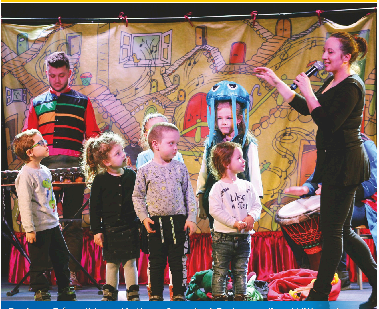
Ferie z Ośrodkiem Kultury Sportu i Rekreacji w Witkowie

Bezpłatny Biuletyn Informacyjny Gminy i Miasta Witkowo Nr 2 - 2018