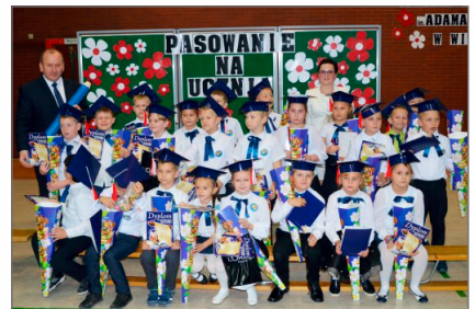
Pasowanie na ucznia w Szkole Podstawowej im. Adama Borysa w Witkowie