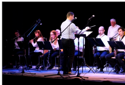
Koncert Jesienny w Centrum Kultury