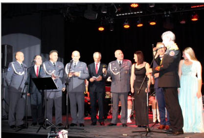
Koncert Utworów Patriotycznych