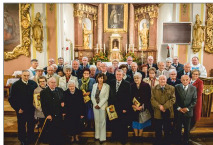
Złote i Diamentowe Gody