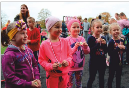
XVII Szkolne Biegi Uliczne za nami