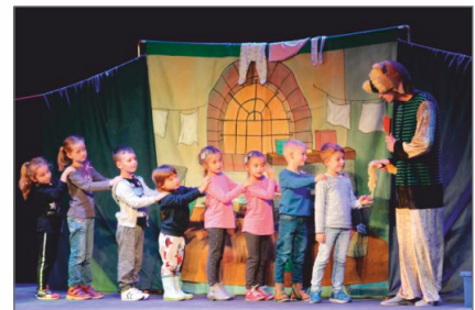
Atrakcje w Centrum Kultury im. Krzysztofa Szkuclarka w Witkowie