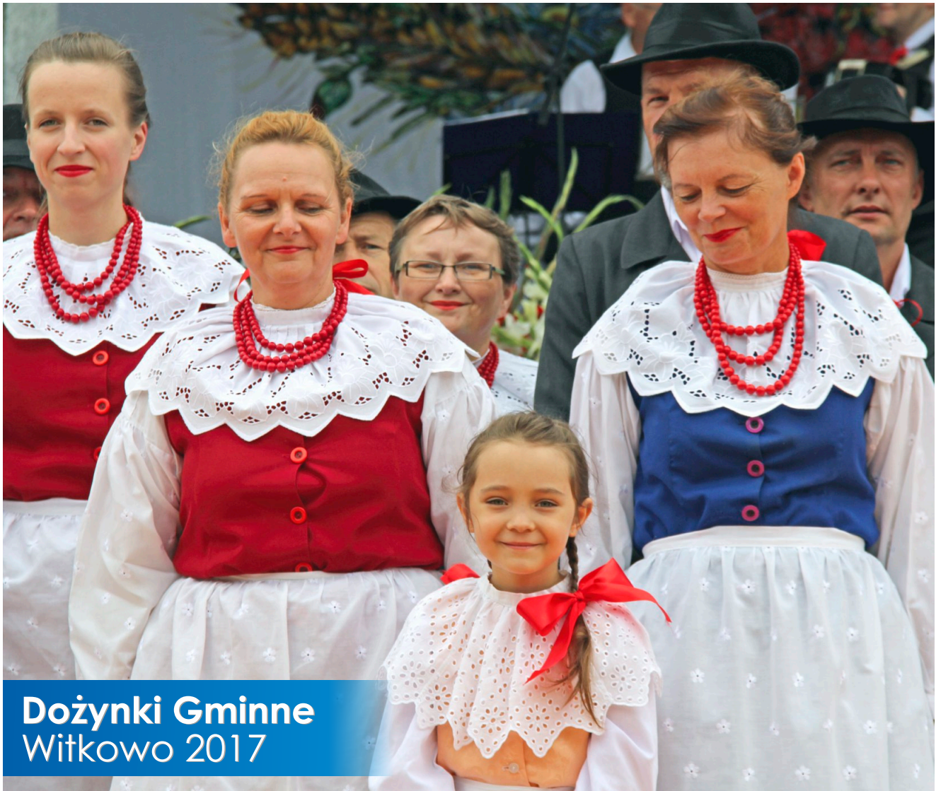
Dożynki Gminne Witkowo 2017

Bezpłatny Biuletyn Informacyjny Gminy i Miasta Witkowo Nr 9 - 2017