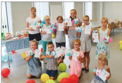
Uroczyste zakończenie „Wakacji z OKSiR Witkowo”