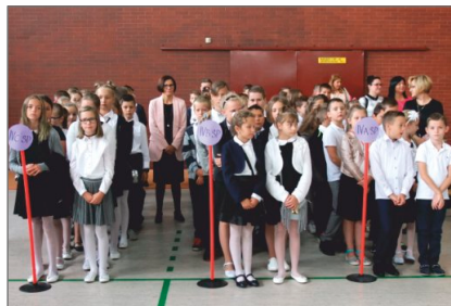
Nowy rok w Szkole Podstawowej im. Adama Borysa w Witkowie