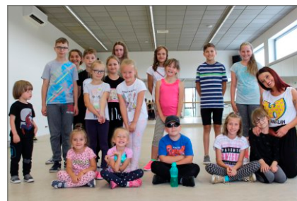
Wakacje z OKSIR Witkowo