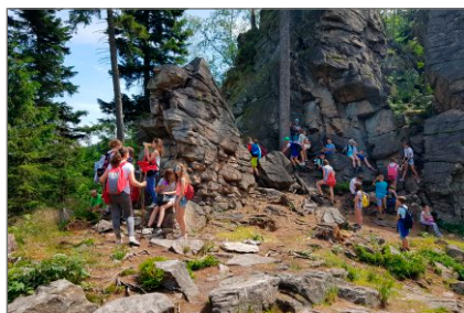
Kolonia profilaktyczna w Łądku Zdroju