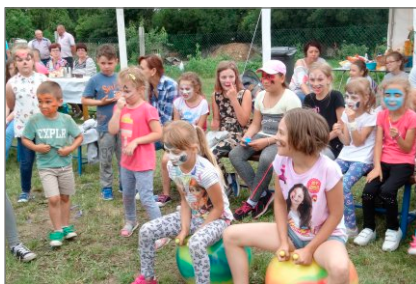
Festyn Rodzinny w Ostrowitym Prymasowskim