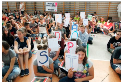
Dopalaczom mówimy: NIE!