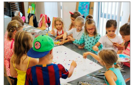
Wakacyjna oferta OKSiR-u