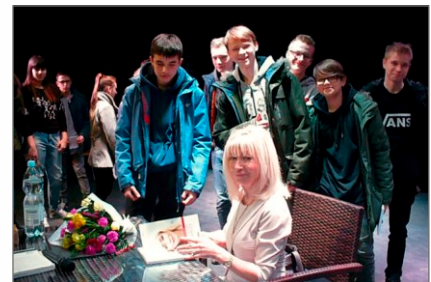
W bibliotece o prawie