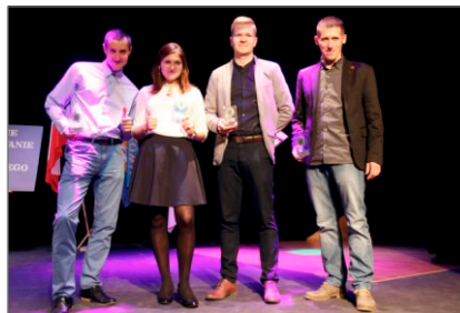
Podsumowanie Gminnego Roku Sportowego 2016