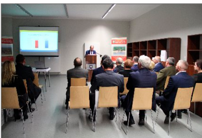
Noworoczne spotkanie z biznesem

VII Sztuka-Ferie z OKSiR-em w Centrum Kultury im. Krzysztofa Szkuclarka w Witkowie