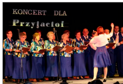
Koncert dla Przyjaciół