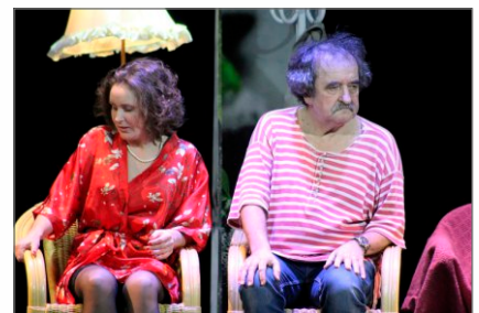
„Separacja” w Centrum Kultury