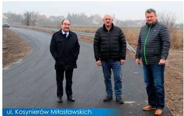
ul. Kosynierów Miłośławskich