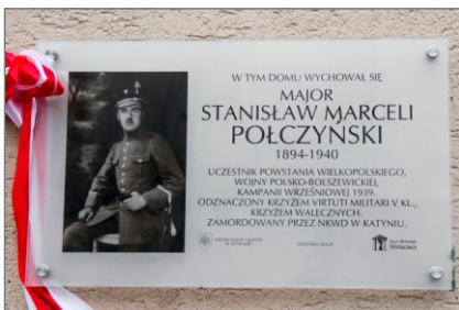
98. rocznica wybuchu Powstania Wielkopolskiego w Witkowie