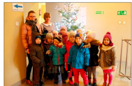
Świąteczne wizyty w Urzędzie