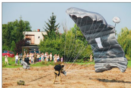
Powiatowe Dni Cichociemnych w Witkowie