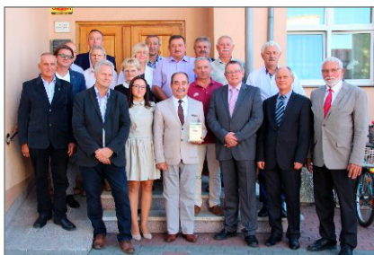
Wizyta delegacji z zaprzyjaźnionej niemieckiej Gminy Am Dobrock