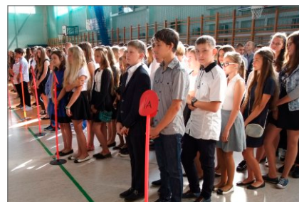
Inauguracja roku szkolnego w Gimnazjum im. Adama Borysa w Witkowie