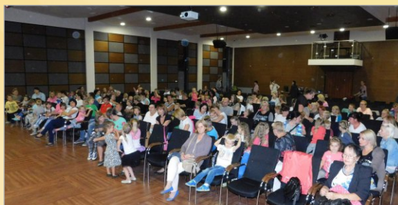
Wakacyjne spotkanie z Teatrem Art-Re z Krakowa