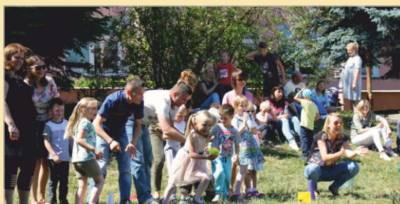
Spotkanie rodzinne w Przedszkolu „Bajka”