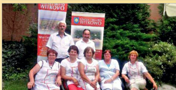
Smaki, Smaczki i Prysmaki - KGW Malenin