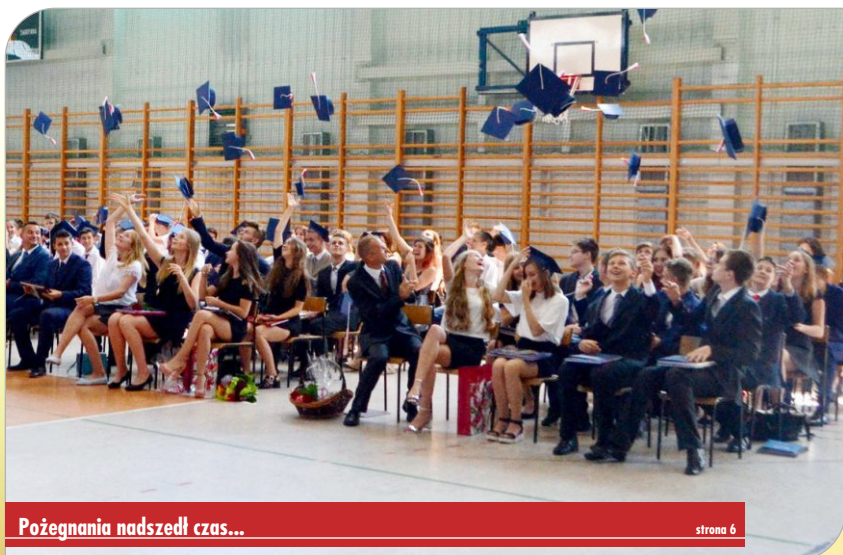
Pożegnania nadszedł czas...