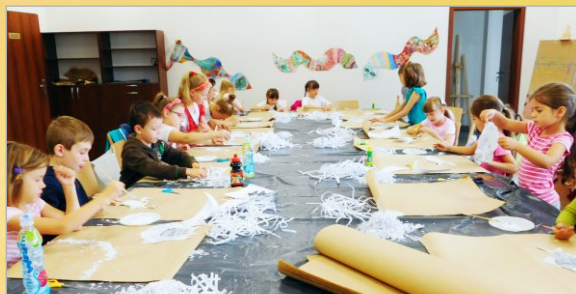
Drugi tydzień wakacji z OKSIR Witkowo