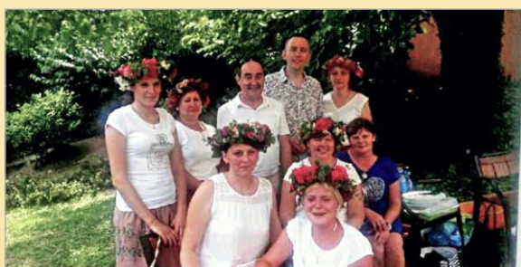
Smaki, Smaczki i Prysmaki - KGW Gorzykowo