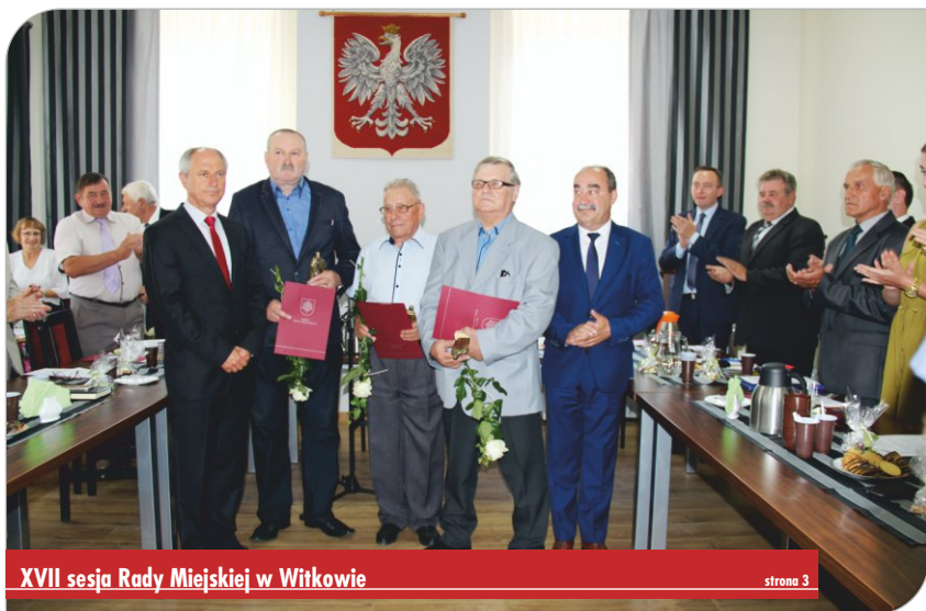
XVII sesja Rady Miejskiej w Witkowie