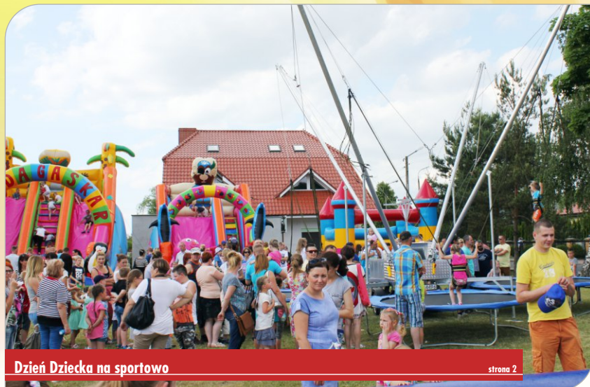
Dzień Dziecka na sportowo