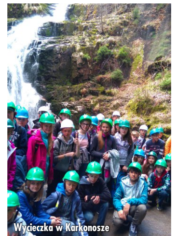
Wycieczka w Karkonosze

zdobywali najwyższy szczyt Karkonoszy oraz Sudetów - Śnieżkę. Trasa wymagała wysiłku, odwagi, zachowania szczególnej ostrożności. Kolejnego dnia - wjeżdżali i zjeżdżali kolejką górską ze Szrenicy. Na samym szczycie, przy pięknej pogodzie, podziwiali panoramę gór