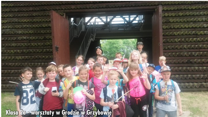
Klasa 2a - warsztaty w Grodzie w Grzybowie