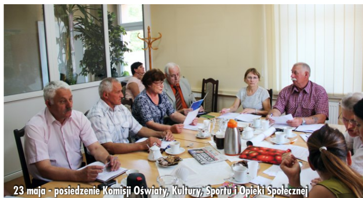
23 maja - posiedzenie Komisji Oświaty, Kultury, Sportu i Opieki Społecznej

W dniu 23 maja br. odbyło się posiedzenie Komisji Oświaty, Kultury, Sportu i Opieki Społecznej. Komisja zapoznała się z przedstawioną przez Dyrektora OKSiR-u realizacją uchwalonego w 2005r. Programu Rozwoju Turystyki i Rekreacji. Prezesi organizacji pozarządowych (Związek Emerytów, Rencistów i Inwalidów oraz Klub Turystyczny PTTK) przedstawili ich bieżącą działalność.