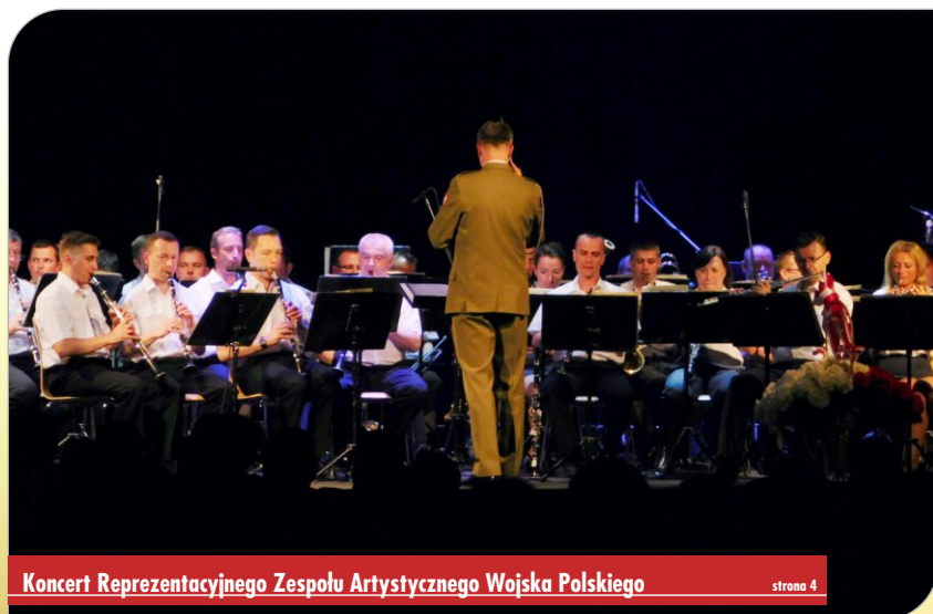
Koncert Reprezentacyjnego Zespołu Artystycznego Wojska Polskiego