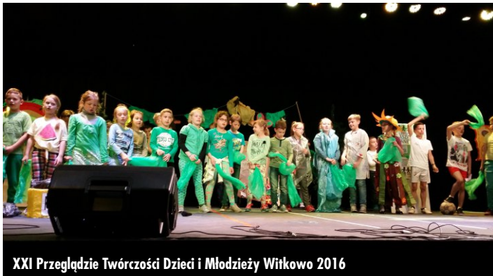
XXI Przeglądzie Twórczości Dzieci i Młodzieży Witkowo 2016