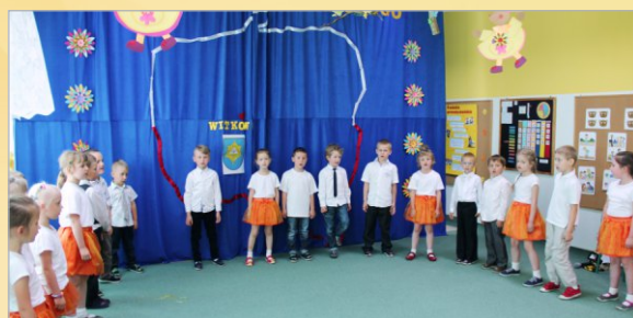
Dzień Samorządowca w Przedszkolu „BAJKA”