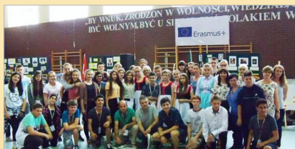
Z życia szkoły w Mielźnie