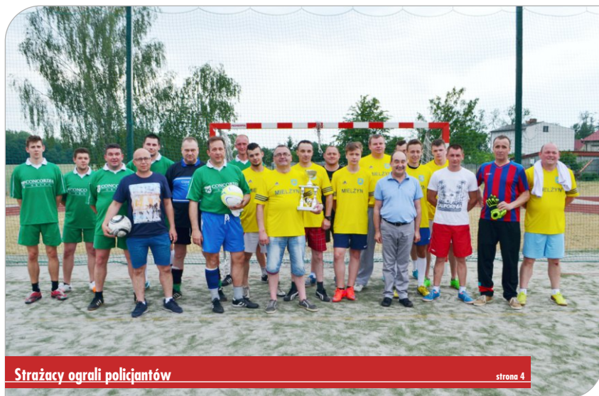
Strażacy ograli policjantów