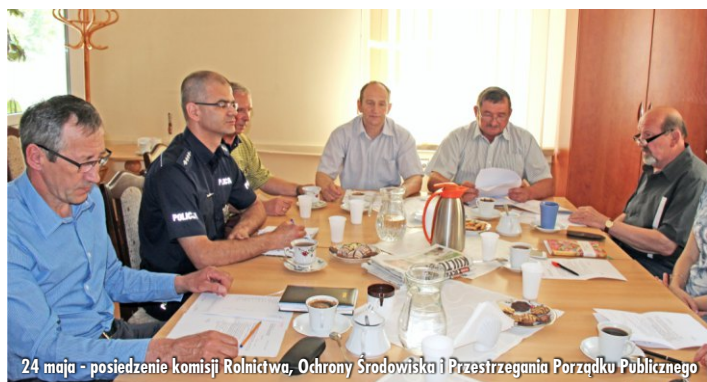
24 maja - posiedzenie komisji Rolnictwa, Ochrony Środowiska i Przestrzegania Porządku Publicznego

W dniu 24 maja br. Komisja Rolnictwa, Ochrony Środowiska i Przestrzegania Porządku Publicznego wysłuchała informacji Dyrektora OKSiR-u i Komendanta Komisariatu Policji o przygotowaniach do sezonu letniego. Zapoznano się również z działalnością Związku Gmin Powiatowego Parku Krajobrazowego i z tematem rekultywacji terenu składowiska odpadów w Chładowie.