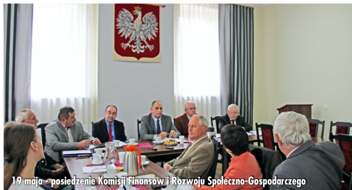
19 maja - posiedzenie Komisji Finansów i Rozwoju Społeczno-Gospodarczego

W dniu 10 maja br. Komisja Rewizyjna rozpoczęła procedurę związaną z absolutorium, za wykonanie budżetu gminy i miasta za 2015r.