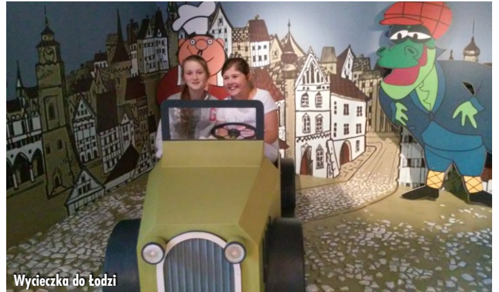
Wycieczka do Łodzi