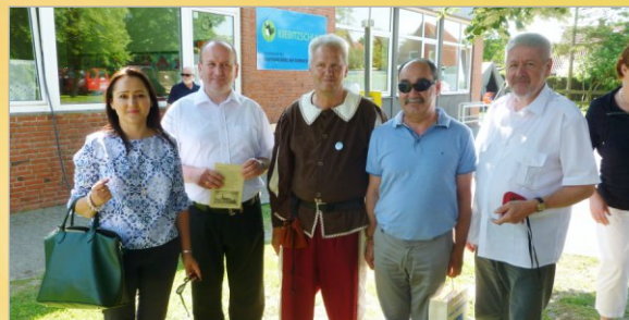
Delegacja z Witkowa podczas uroczystości 700-lecia gminy Oberndorf