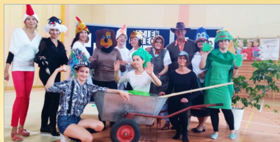
W Szkole Podstawowej im. Lotnictwa Polskiego w Witkowie ...