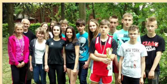
Sukcesy naszej młodzieży