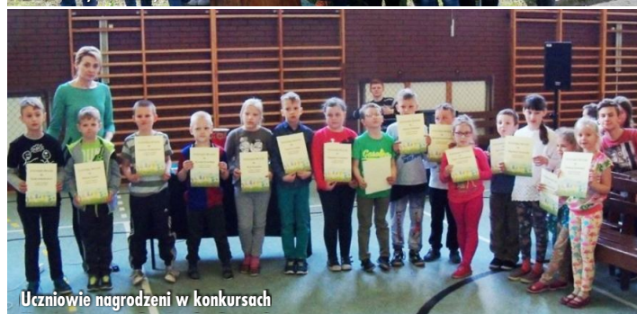
Uczniowie nagrodzeni w konkursach