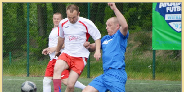
Amigos z pucharem Burmistrza