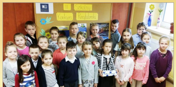
W Szkole Podstawowej im. Lotnictwa Polskiego w Witkowie ...