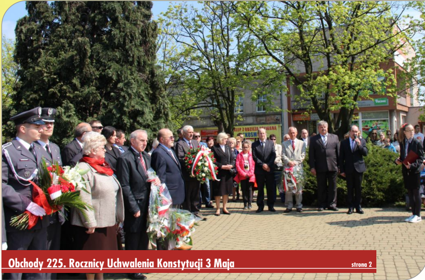
Obchody 225. Rocznicy Uchwalenia Konstytucji 3 Maja