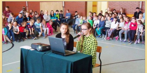
Z życia szkoły w Mielźnie