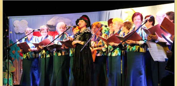
„AMBARAS W BAJKOWYM LESIE”