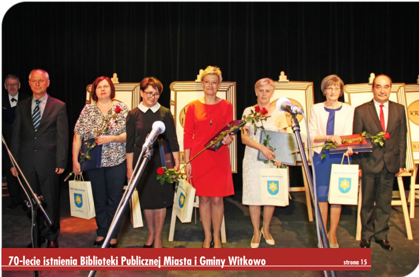
70-lecie istnienia Biblioteki Publicznej Miasta i Gminy Witkowo