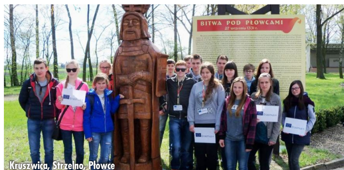
Kruszwica, Strzelno, Płowce