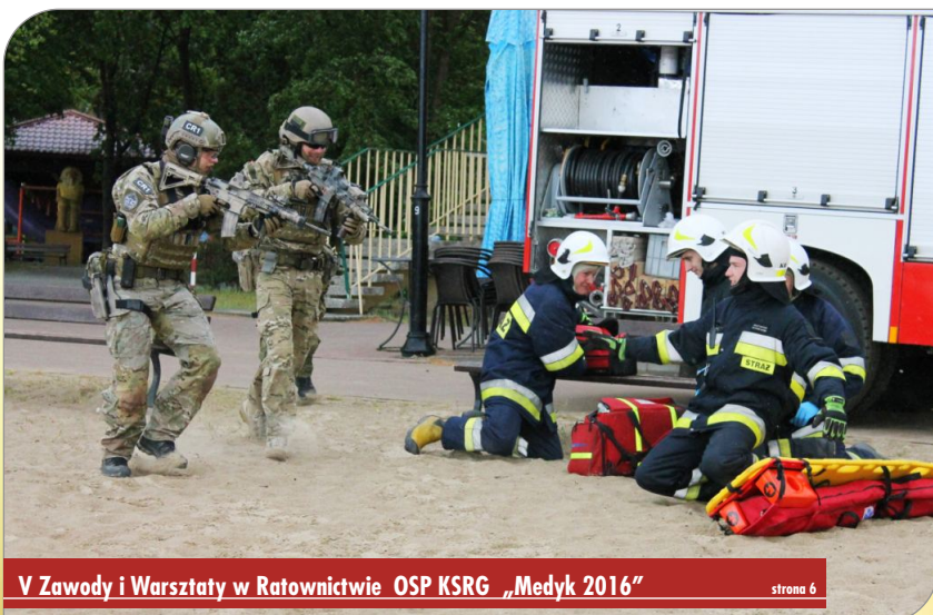
V Zawody i Warsztaty w Ratownictwie OSP KSRG „Medyk 2016”