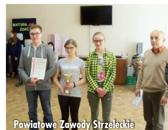
Powiatowe Zawody Strzeleckie

22 kwietnia wzięliśmy udział w Powiatowych Zawodach Strzeleckich w Gnieźnie. Odbyły się one w Zespole Szkół Ponadgimnazjalnych.