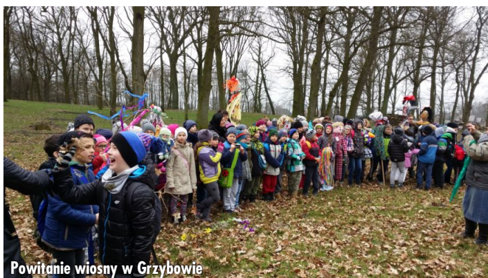
Powitanie wiosny w Grzybowie