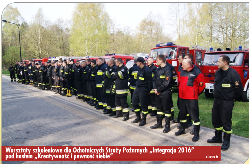
Warsztaty szkoleniowe dla Ochotniczych Straży Pożarnych „Integracja 2016” pod hasłem „Kreatywność i pewność siebie”