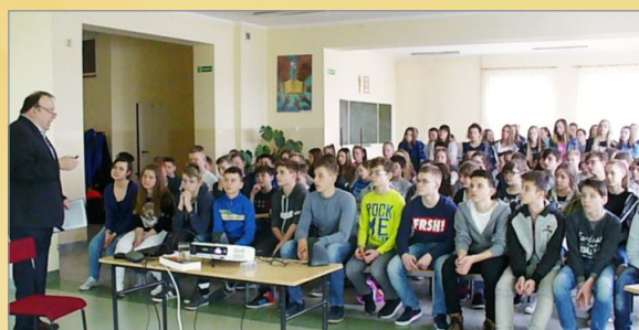
Lekcja historii inaczej