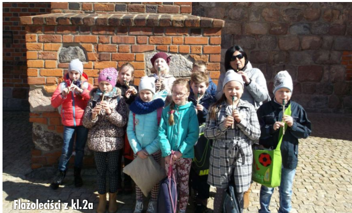
Flażolecista z kl. 2a