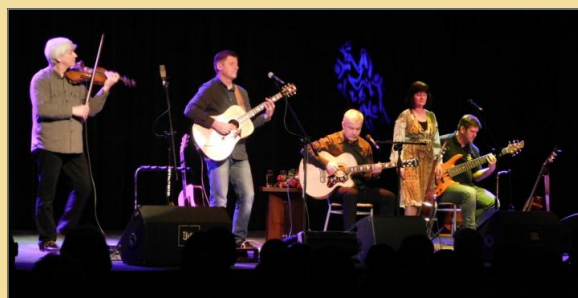
Koncert zespołu „U Studni”