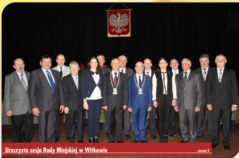
Uroczysta sesja Rady Miejskiej w Witkowie