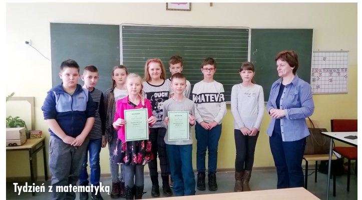
Tydzień z matematyką