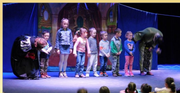
Spektakl Teatru Art-Re pt. „Skrzat Titelitury”