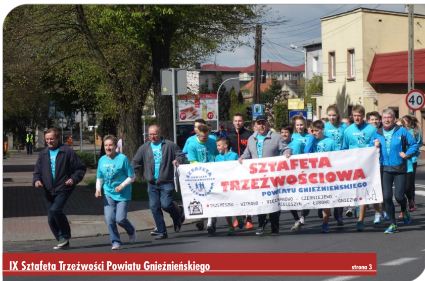
IX Sztafeta Trzeźwości Powiatu Gnieźnieńskiego