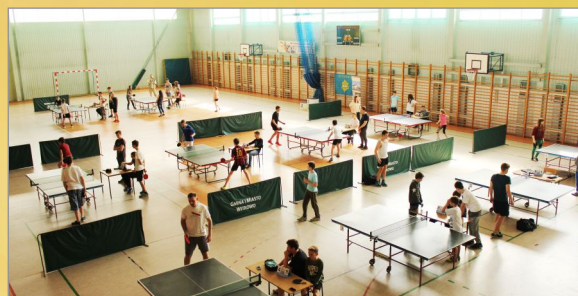
Otwarte Mistrzostwa Gminy Amatorów w Tenisie Stołowym