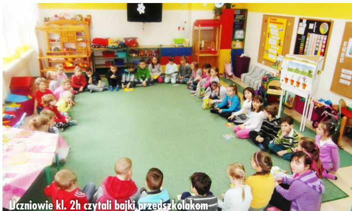
Uczniowie kl. 2h czytali bajki przedszkolakom

W ramach akcji „Mądra szkoła czyta dzieciom” uczniowie klasy 2 h wraz z wychowawczynią N. Biesek wybrali się do