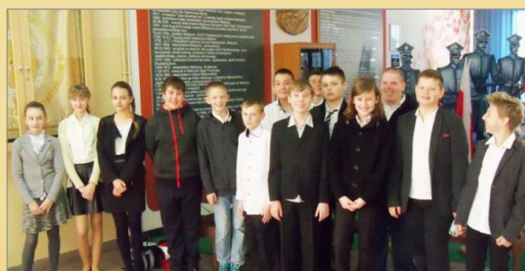
Z życia szkoły w Mielźnie