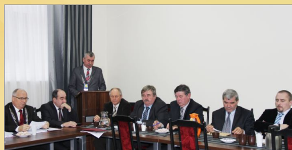
Ostatnia sesja Rady Miejskiej kadencji 2010-2014