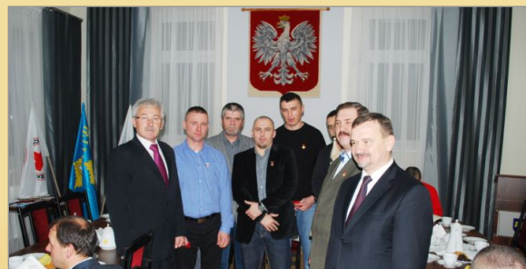
Jubileusz Klubu Honorowych Dawców Krwi PCK