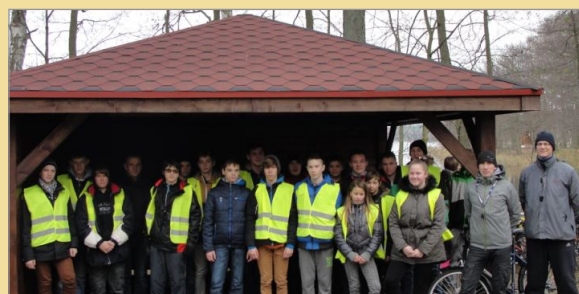
Projekt współpracy Szlak Ukrytych Skarbów