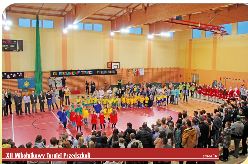
XII Mikołajkowy Turniej Przedszkoli