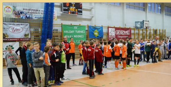
XV Turniej Halowej Piłki Nożnej im. Walentego Olczaka