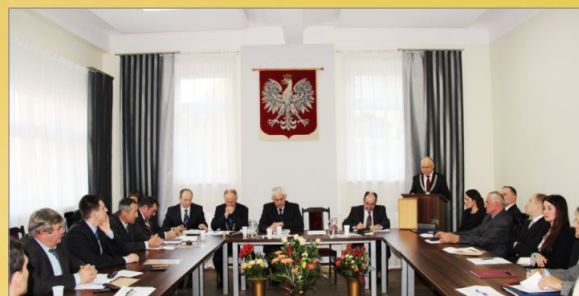
I inauguracyjna sesja Rady Miejskiej