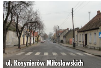
ul. Kosynierów Miłostawskich