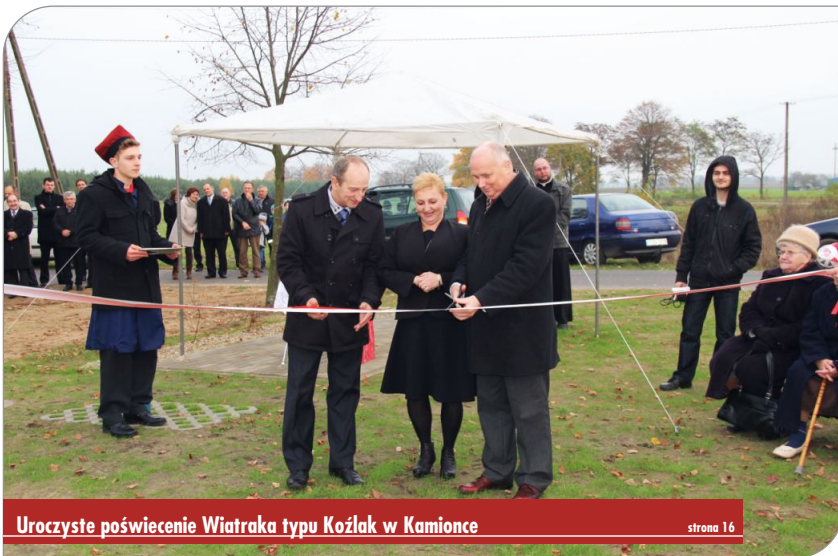
Uroczyste poświęcenie Wiatraka typu Kozłak w Kamionce