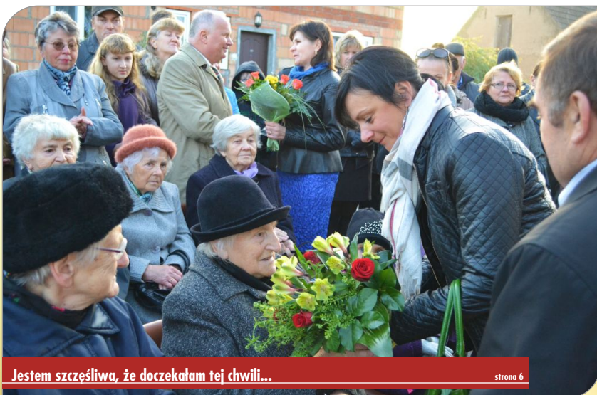
Jestem szczęśliwa, że doczekałam tej chwili...