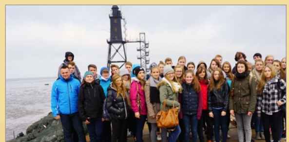
6 dni nad Morzem Północnym