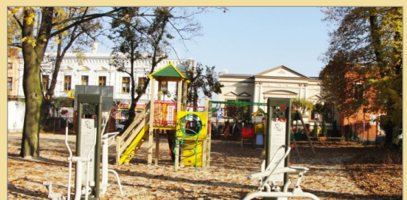
LEADER w Gminie Witkowo