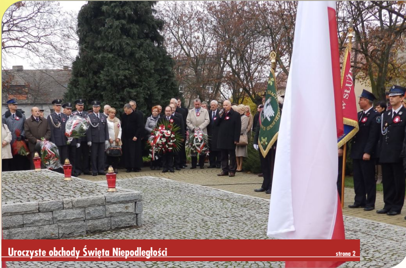
Uroczyste obchody Święta Niepodległości