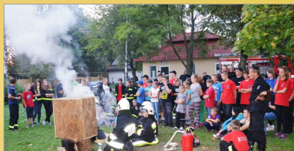
Gminny biwak szkoleniowy MDP 2014