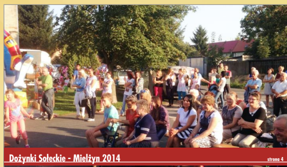
Dożynki Soleczkie - Mielżyn 2014