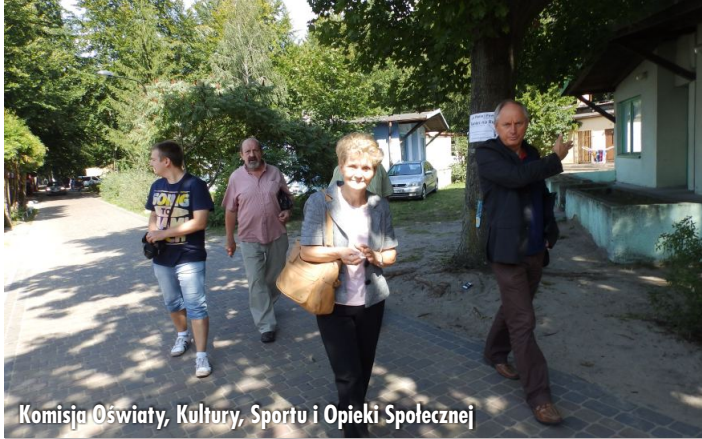
Komisja Oświaty, Kultury, Sportu i Opieki Społecznej

W dniu 22 sierpnia br. Komisja Oświaty, Kultury, Sportu i Opieki Społecznej na wyjazdowym posiedzeniu zapoznana się z funkcjonowaniem Ośrodka Wypoczynkowego w Skorzęcinie, w trakcie trwania sezonu letniego.