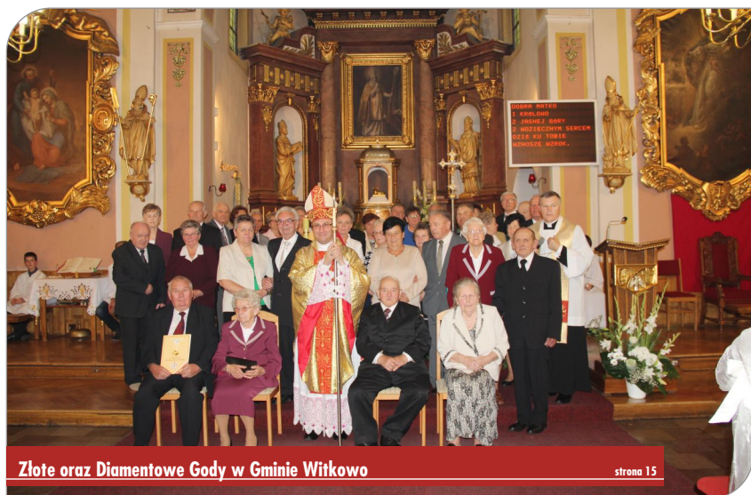
Złote oraz Diamentowe Gody w Gminie Witkowo