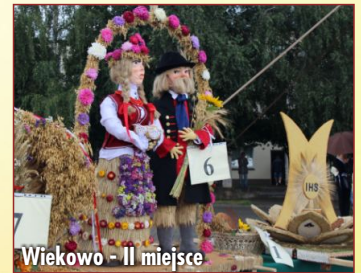
Wiekowo - II miejsce