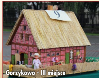
Gorzykowo - III miejsce