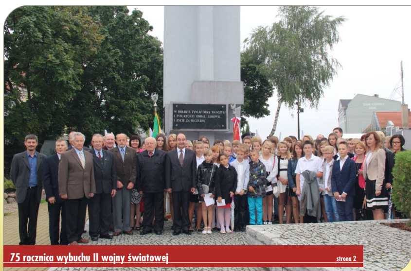
75 rocznica wybuchu II wojny światowej