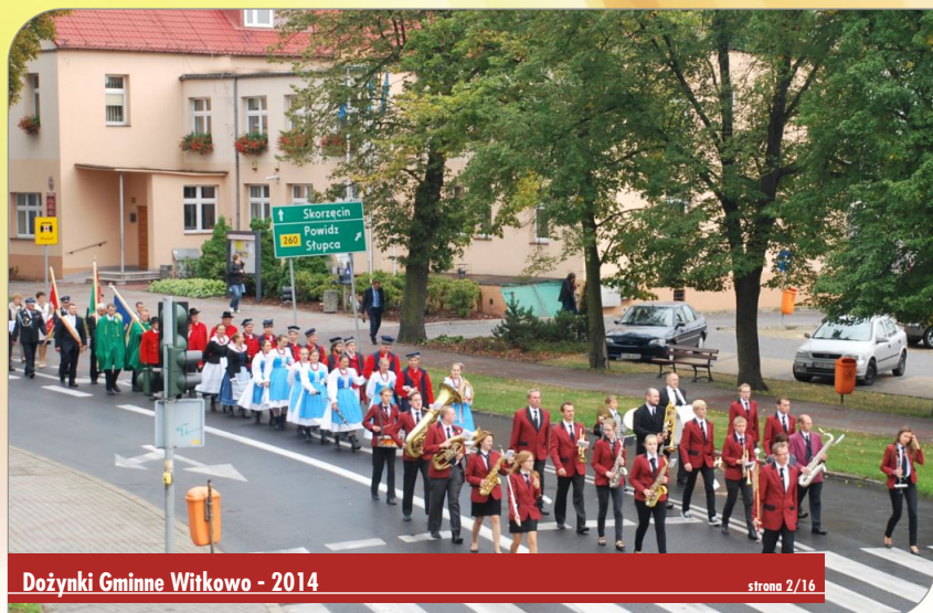
Dożynki Gminne Witkowo - 2014