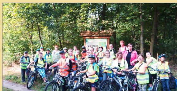
Rajd Rowerowy Witkowo - Skorzecin Uczniów ze SP w Witkowie