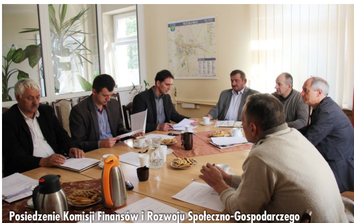
Posiedzenie Komisji Finansów i Rozwoju Społeczno-Gospodarczego