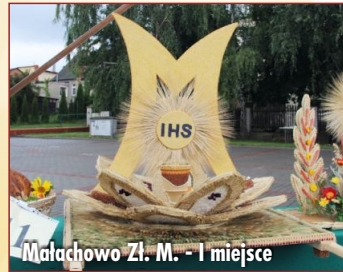
Małachowo Żł. M. - I miejsce