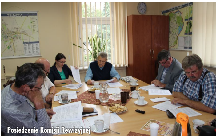
Posiedzenie Komisji Rewizyjnej

zapoznana się z realizacją spłat zaciągniętych przez gminę kredytów bankowych i z realizacją inwestycji. Ponadto na posiedzeniu Kierownik Zakładu Gospodarki