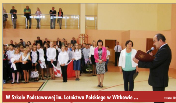
W Szkole Podstawowej im. Lotnictwa Polskiego w Witkowie ...