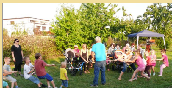
Dzień Działkowca w Rodzinnych Ogrodach Działkowych im. LLP w Witkowie