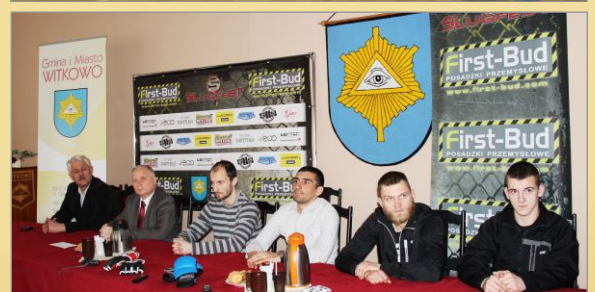
Konferencja prasowa związana z galą MMA Slugfest