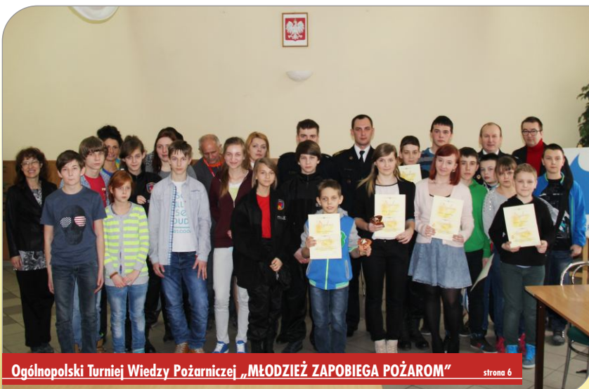
Ogólnopolski Turniej Wiedzy Pożarniczej „MŁODZIEŻ ZAPOBIEGA POŻAROM”