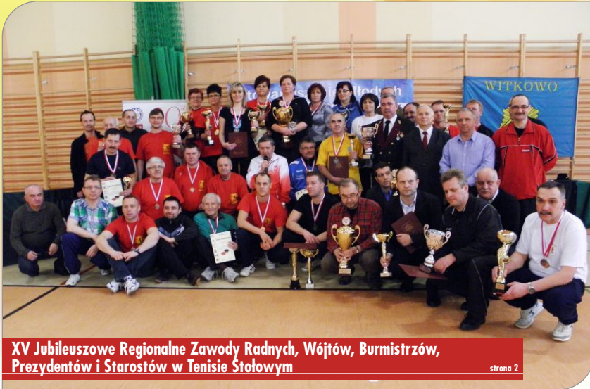
XV Jubileuszowe Regionalne Zawody Radnych, Wójtów, Burmistrzów, Prezydentów i Starostów w Tenisie Stołowym