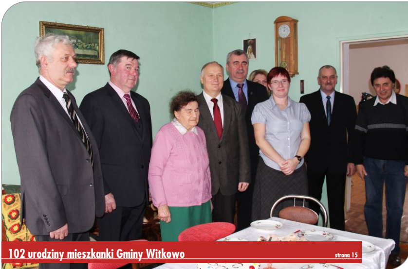
102 urodziny mieszkanki Gminy Witkowo