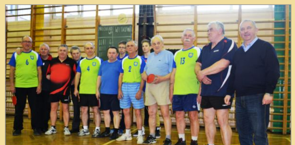
Towarzyski Mecz Tenisa Stołowego WITKOWO - NIECHANOWO