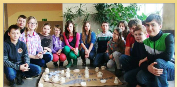
Z życia Zespołu Szkolno-Przedszkolnego w Mielżynie