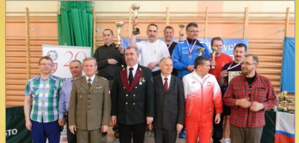
Zawody strzeleckie z karabinka pneumatycznego dla radnych, wójtów, burmistrzów, prezydentów i starostów z Wielkopolski z okazji 70-lecia LOK