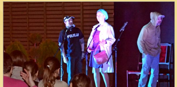
Wieczór pełen humoru, satyry i dowcipu