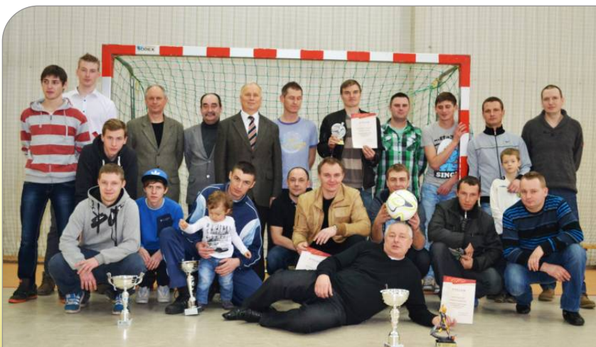
XI edycja Mistrzostw Gminy Witkowo w Halowej Piłce Nożnej zakończona