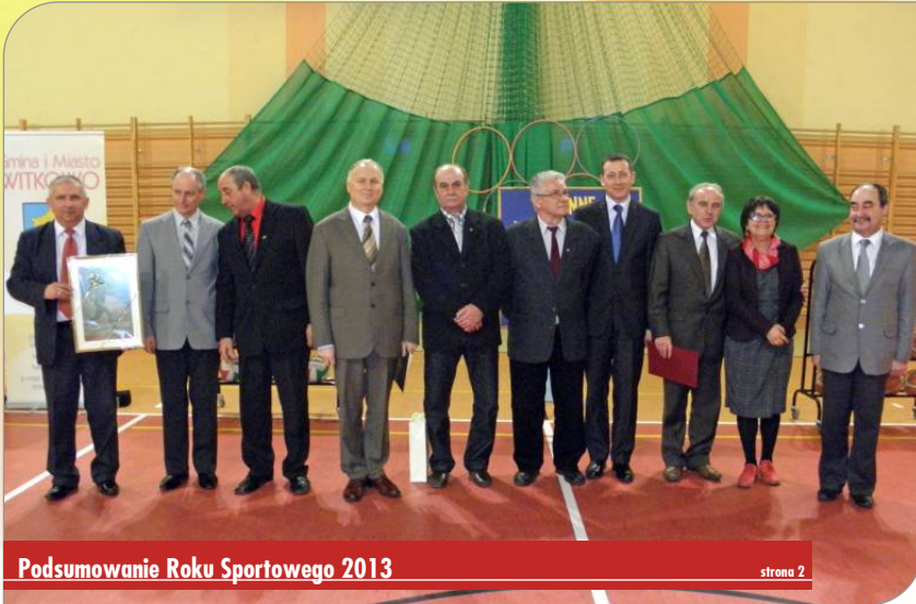
Podsumowanie Roku Sportowego 2013