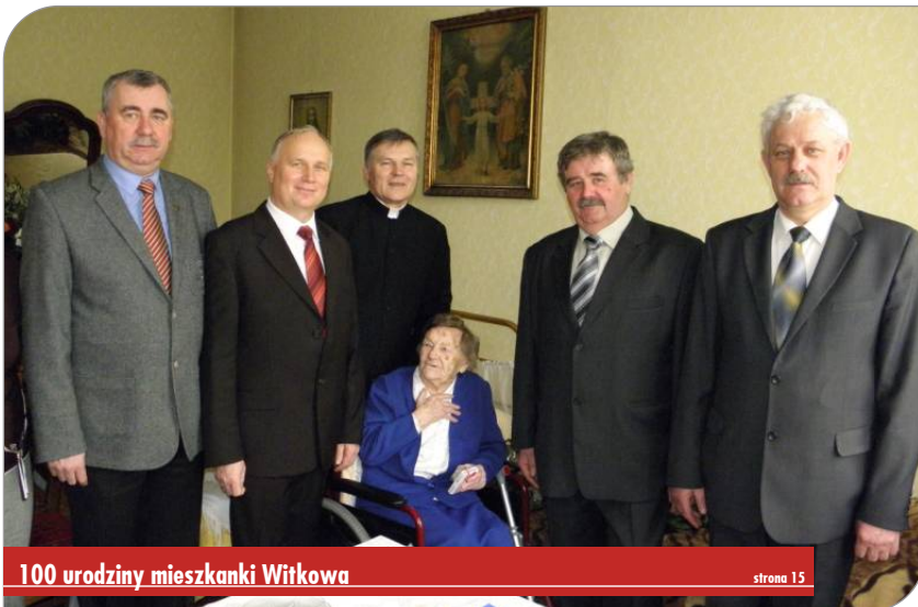
100 urodziny mieszkanki Witkowa