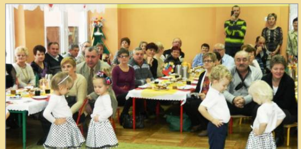
Dzień Babci i Dziadka w „Bajce”