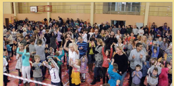
Karnawałowa przygoda w Hali Widowiskowo - Sportowej w Witkowie!