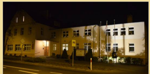
„Światło dla Majdanu”