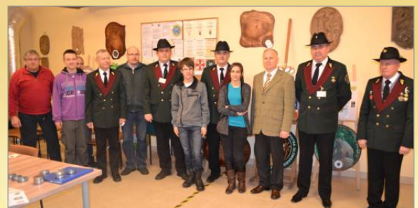
Ruszyła liga strzelecka