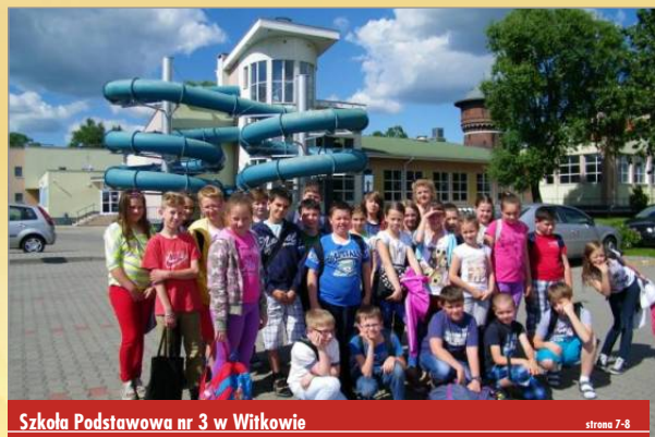
Szkoła Podstawowa nr 3 w Witkowie