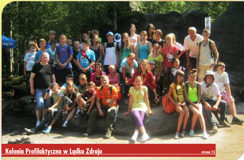
Kolonia Profilaktyczna w Łądku Zdroju