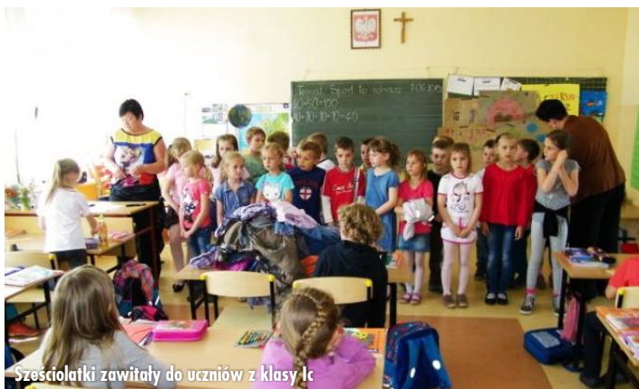
Sześciolatki zawiąły do uczniów z klasy 1c