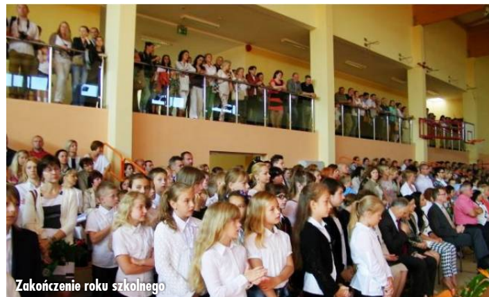
Zakończenie roku szkolnego