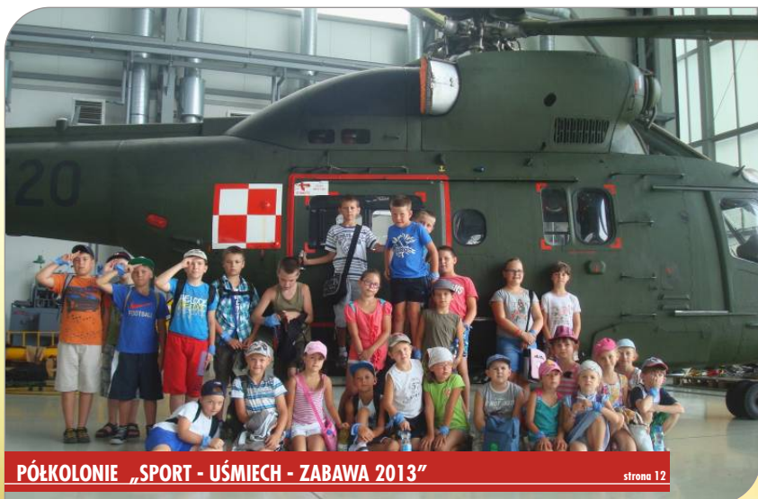
PÓŁKOLONIE „SPORT - UŚMIECH - ZABAWA 2013”