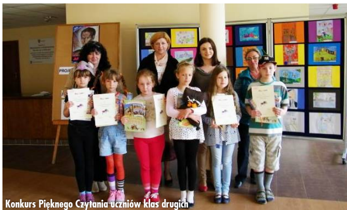
Konkurs Pięknego Czytania uczniów klas drugich

Po raz siódmy odbył się Konkurs Pięknego Czytania uczniów klas drugich zorganizowany przez bibliotekę szkolną . Jego celem jest budzenie nowych zainteresowań czytelniczych, wzbogacenie i pogłębienie przeżyć estetycznych i moralnych, zdobywanie wiedzy o świecie, kształcenie nawyku pięknego i poprawnego czytania. Zgodnie z Regulaminem konkursu biorą w nim udział uczniowie klas II (po 2 uczniów z każdej szkoły) i obowiązują ich ciekawe zaprezentowanie ulubionej książki, piękne przeczytanie jej fragmentu (ok. 2-3 min) oraz przeczytanie nowego tekstu. Jury natomiast ocenia technikę czytania przygotowanego i nowego tekstu (intonację, wyrazistość, tempo) oraz pomysłowość prezentacji książki.