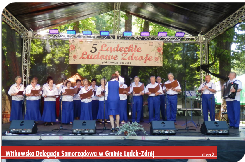
Witkowska Delegacja Samorządowa w Gminie Łądek-Zdrój