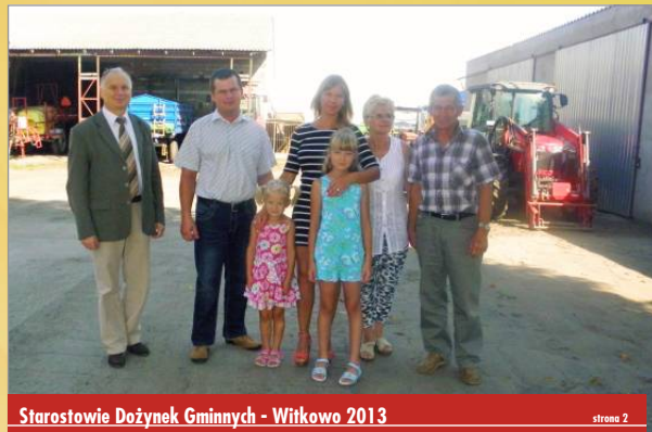
Starostwie Dożynek Gminnych - Witkowo 2013