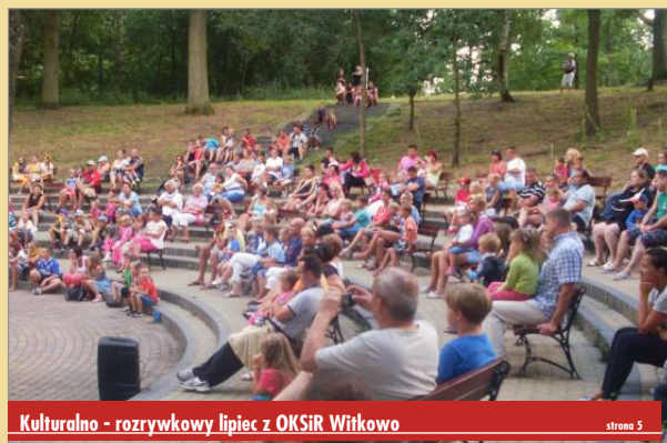
Kulturalno - rozrywkowy lipiec z OKSiR Witkowo