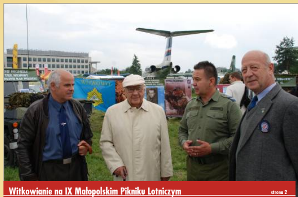
Witkowanie na IX Małopolskim Pikniku Lotniczym