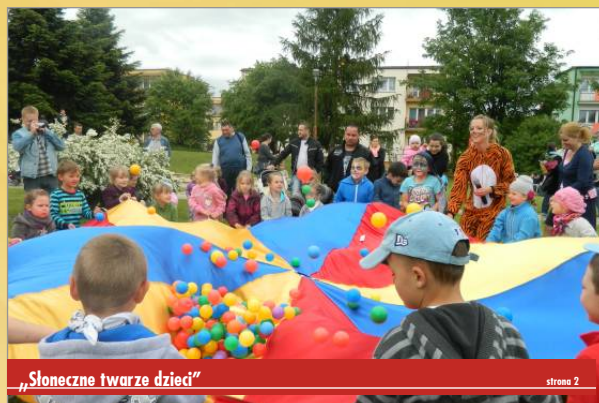
„Słoneczne twarze dzieci”