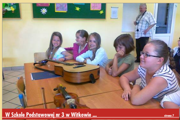
W Szkole Podstawowej nr 3 w Witkowie ...