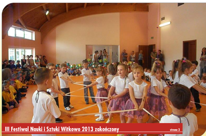
III Festiwal Nauki i Sztuki Witkowo 2013 zakończony