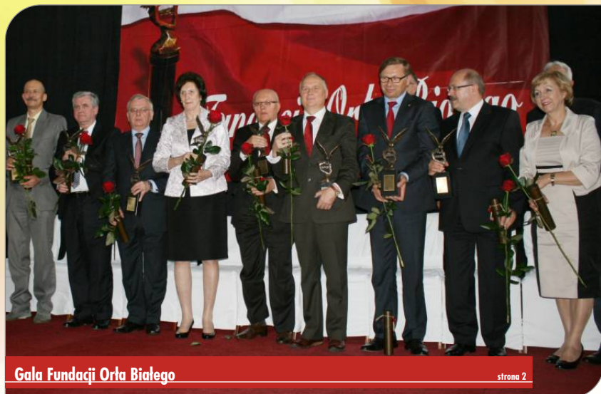
Gala Fundacji Orła Białego