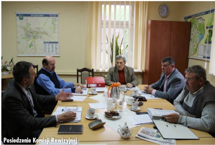
Posiedzenie Komisji Rewizyjnej

W dniu 15 maja br. Komisja Oświaty, Kultury, Sportu i Opieki Społecznej wysłuchała informacji Dyrektora OKSiR-u o realizacji „Programu Rozwoju Turystyki i rekreacji na terenie Gminy Witkowo” i informacji Dyrektora Biblioteki Publicznej o działalności Bibliotek. Ponadto jednym z punktów posiedzenia było spotkanie z wychowawczyniami Świetlicy Środowiskowej, które przedstawiły sprawy związane z funkcjonowaniem Świetlicy.