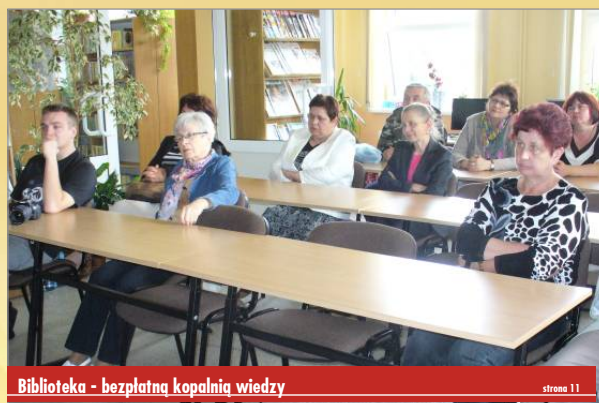
Biblioteka - bezpłatną kopalnię wiedzy