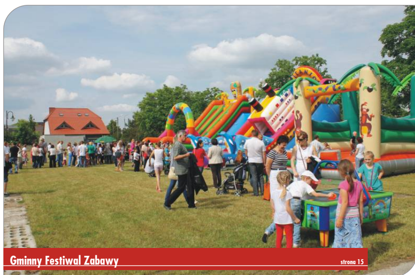
Gminny Festiwal Zabawy