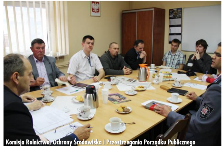
Komisja Rolnictwa, Ochrony Środowiska i Przestrzegania Porządku Publicznego