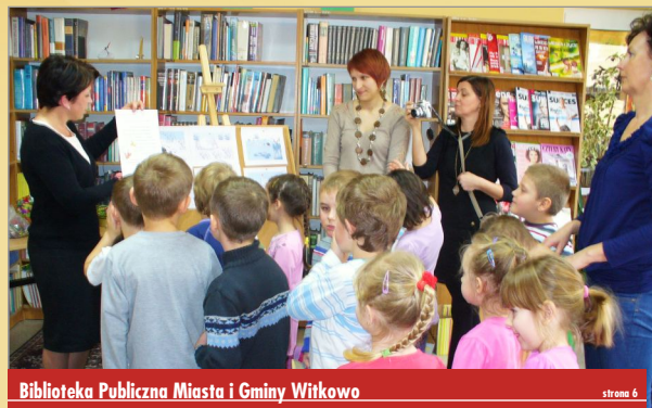
Biblioteka Publiczna Miasta i Gminy Witkowo