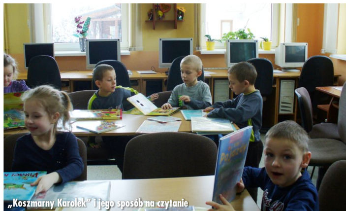
„Kozmarny Karolek” i jego sposób na czytanie

Literatura piękna ukazuje nam bogactwo otaczającego nas świata, otwiera nasze serca na innych i na samych siebie. Odstania przed każdym z nas złożoność ludzkich doznań, uczuć i przeżyć. Wyjaśnia pewne zachowania i sprawia, że młody człowiek nie czuje się osamotniony w swoich lękach, cierpieniach i radościach.