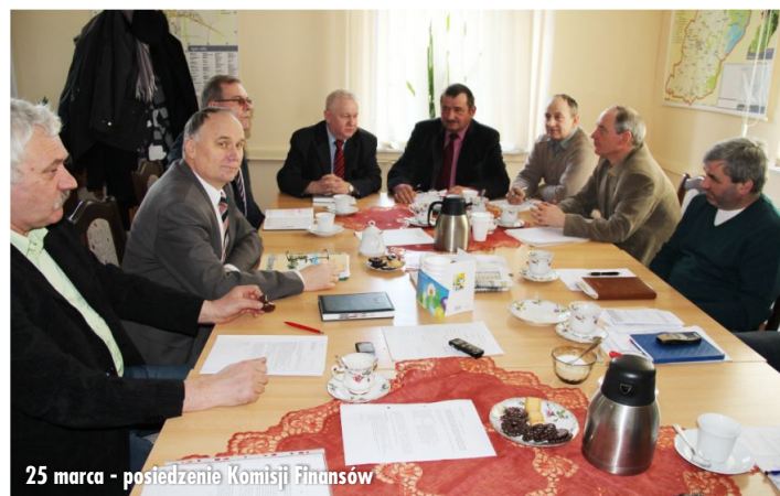
25 marca - posiedzenie Komisji Finansów