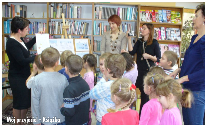
Mój przyjaciel - Książka