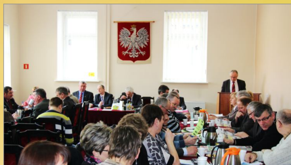
XXIV Sesja Rady Miejskiej w Witkowie