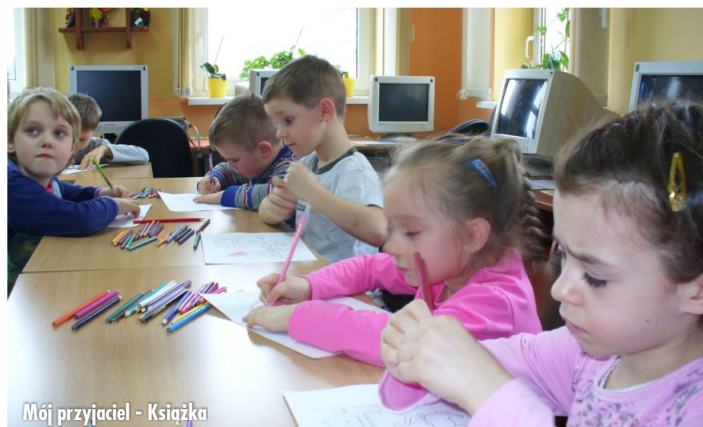
Mój przyjaciel - Książka