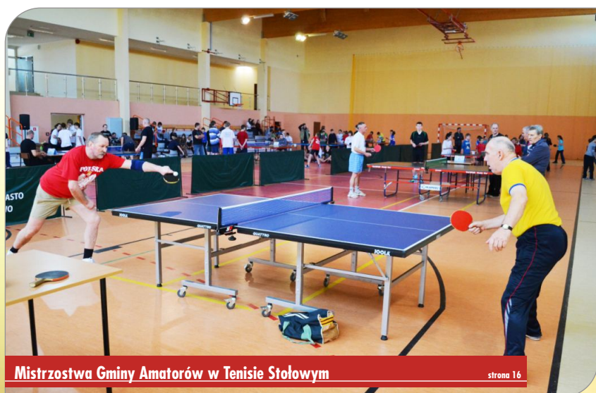
Mistrzostwa Gminy Amatorów w Tenisie Stołowym