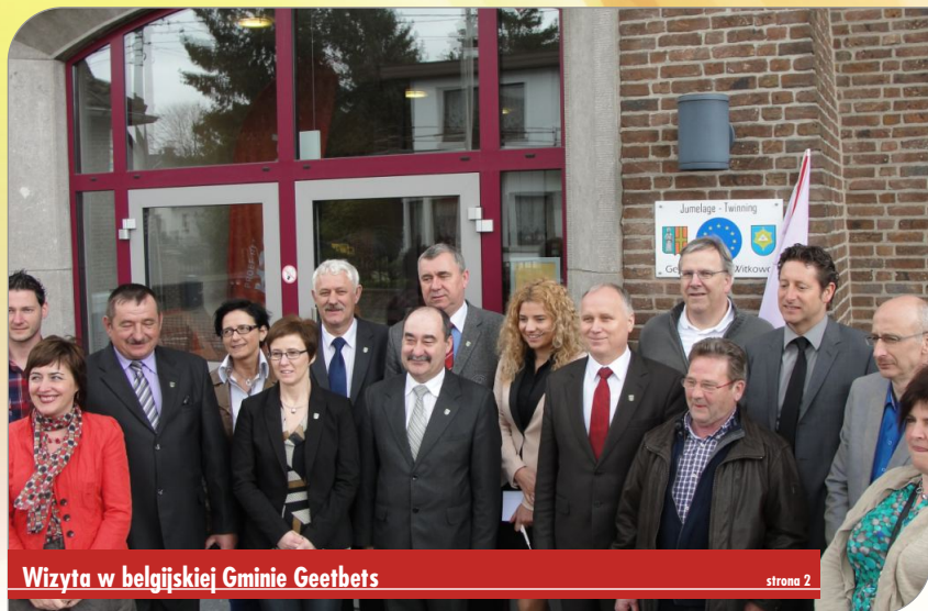
Wizyta w belgijskiej Gminie Geetbets