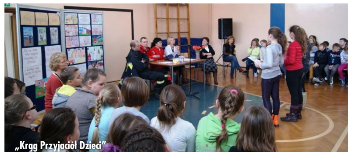
„Krag Przyjaciół Dzieci”

Tradycyjnie w marcu młodzi uczniowie uroczystie pożegnali zimą i przywitani kolejną porą roku - wiosną, a starsi przygotowali Dzień Samorządności. Do wspólnej zabawy zaproszeni zostali wszyscy uczniowie,