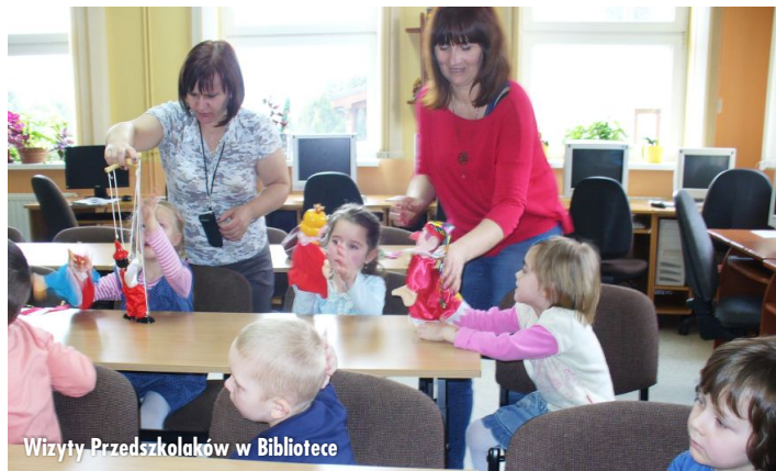
Wizyty Przedszkolaków w Bibliotece

To uświadamiają sobie nauczyciele, a potem rodzice. Kształtowanie gustu estetycznego utrwała się poprzez książki, przez to, jak zorganizowana jest praca z książką w przedszkolu, domu i bibliotece.