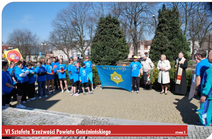
VI Sztafeta Trzeźwości Powiatu Gnieźnieńskiego