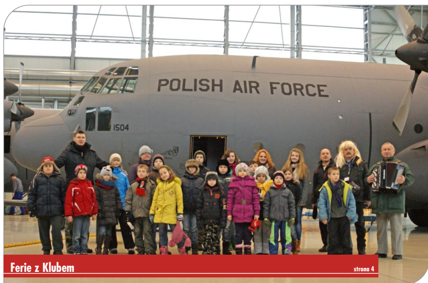
Ferie z Klubem