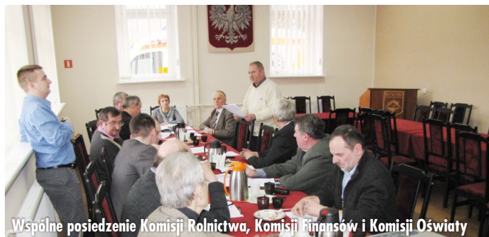
Wspólne posiedzenie Komisji Rolnictwa, Komisji Finansów i Komisji Oświaty

W dniu 10 stycznia br. odbyło się kolejne posiedzenie Komisji Rewizyjnej. Komisja dokonała kontroli w Szkole Podstawowej w Gorzykowie i kontroli Świetlicy Wiejskiej w Maleninie.