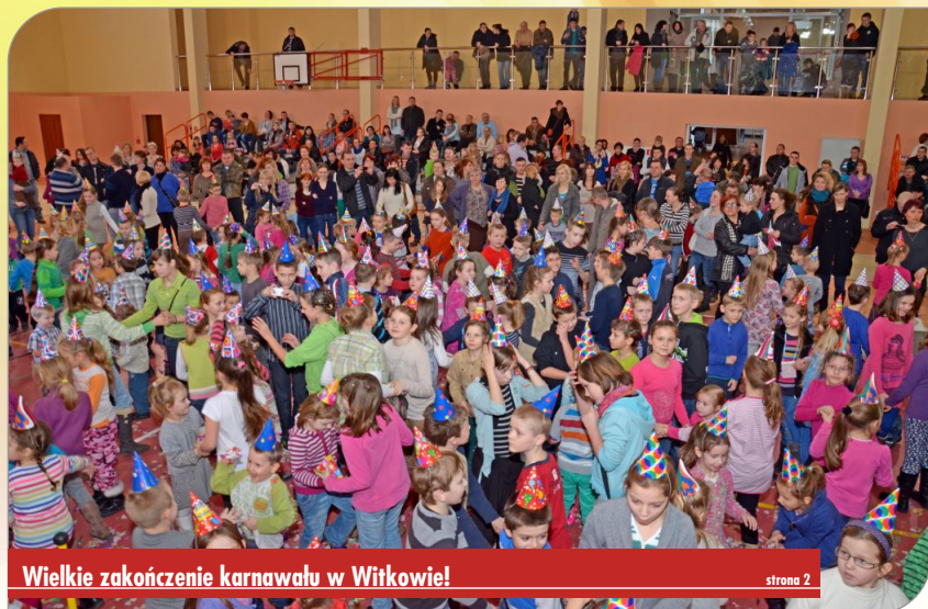
Wielkie zakończenie karnawału w Witkowie!