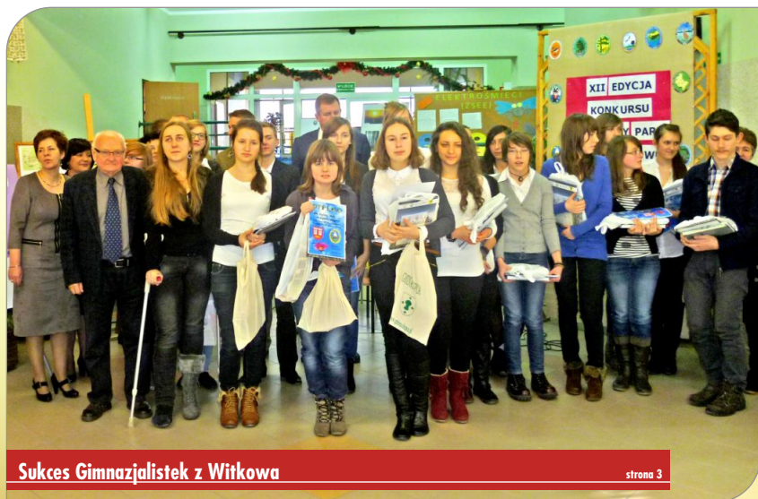
Sukces Gimnazjalistek z Witkowa