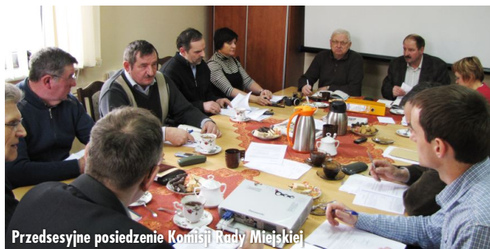
Przedsesyjne posiedzenie Komisji Rady Miejskiej

W dniach 11, 12 i 13 lutego br., odbyły się przedsesyjne posiedzenia Komisji Rady Miejskiej, dla zaopiniowania projektów uchwał, przygotowanych na lutową sesję Rady. Oprócz tematów związanych z sesją, Komisja Oświaty zapoznała się z sytuacją finansową w oświacie, Komisja Rolnictwa zapoznała się z działalnością Związku Gmin Powidzkiego Parku Krajobrazowego w 2012 roku, natomiast Komisja Finansów - m.in. z realizacją uchwały dotyczącej opłat za zajmowanie pasa drogowego dróg gminnych.